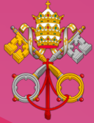
DICASTERIO DE LA CULTURA Y LA EDUCACIÓN

UPAEP: La Universidad Popular Autónoma del Estado de Puebla es una institución privada de educación superior líder en el centro-sur de México. Fundada en 1973, actualmente cuenta con 65 programas de licenciatura, más de 80 posgrados e incontables cursos de educación continua. Además, gestiona la red de preparatorias más grande del sureste del país, con 10 planteles. UPAEP integra la Federación de Instituciones Mexicanas Particulares de Educación Superior, la Asociación Nacional de Universidades e Instituciones de Educación Superior además de mantener vínculos estables con instituciones de prestigio a nivel mundial como el Instituto Tecnológico de Massachusetts, la Universidad de Harvard, la Universidad de Arizona y la Universidad de Notre Dame.