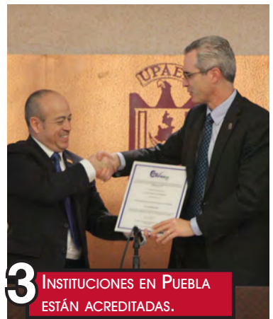
3 INSTITUCIONES EN PUEBLA ESTÁN ACREDITADAS.