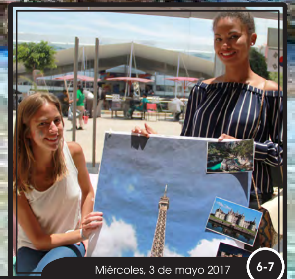
Miércoles, 3 de mayo 2017