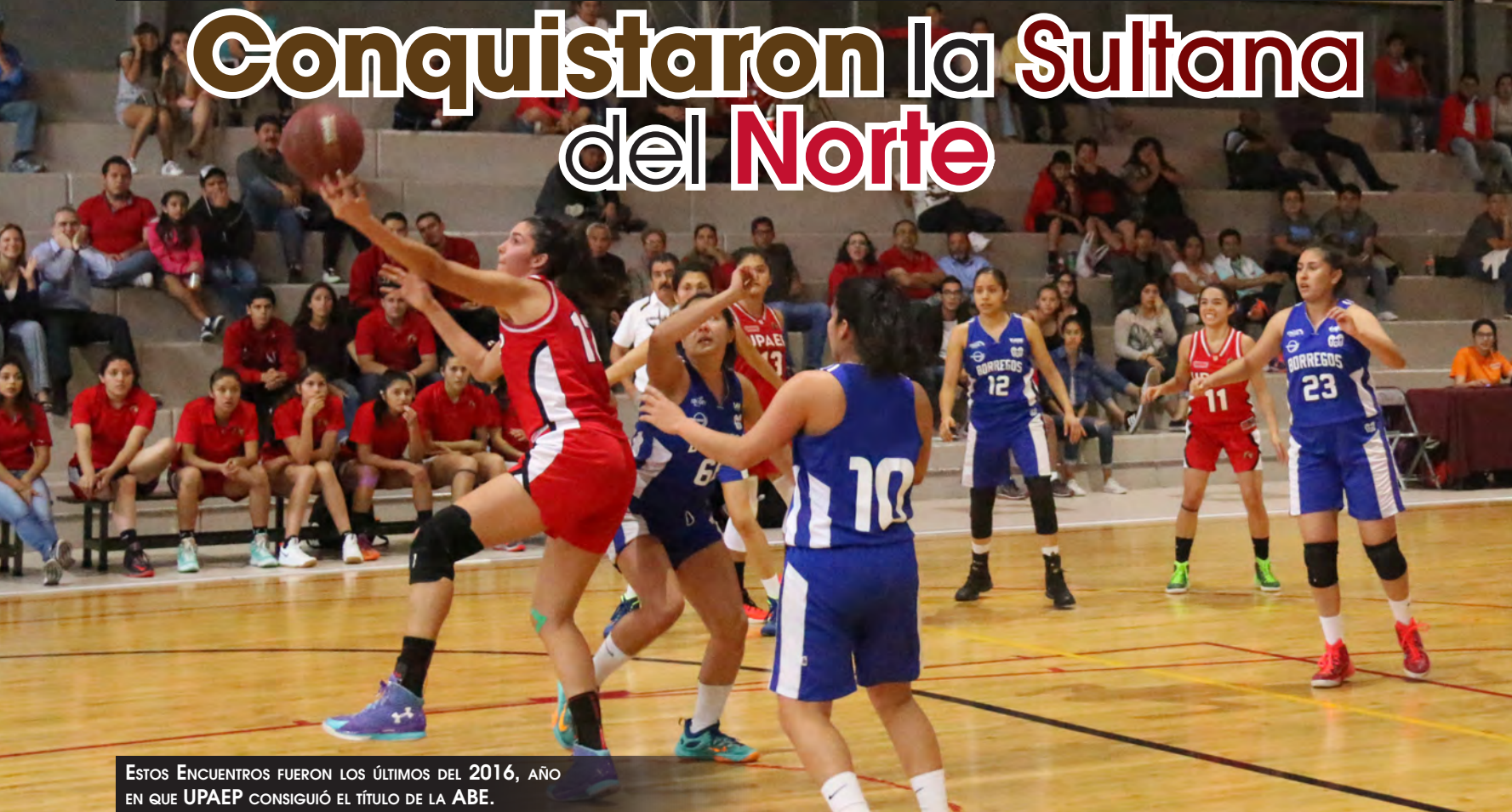
ESTOS ENCUENTROS FUERON LOS ÚLTIMOS DEL 2016, AÑO EN QUE UPAEP CONSIGUIÓ EL TÍTULO DE LA ABE.