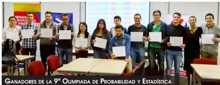
GANADORES DE LA 9ª OLIMPIADA DE PROBABILIDAD Y ESTADÍSTICA