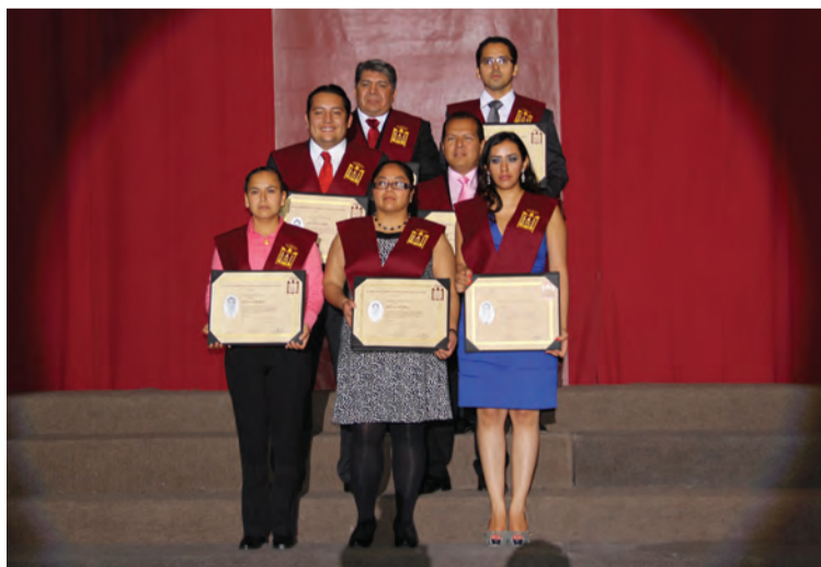
UPAEP Abierta y UPAEP Online