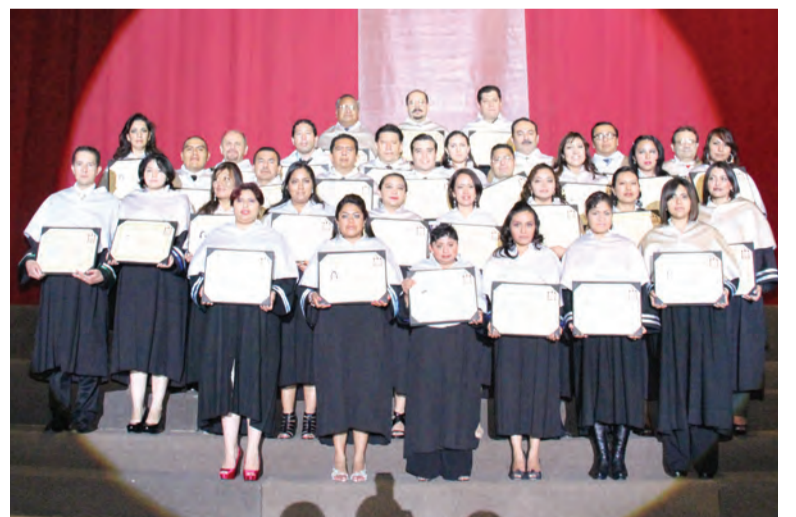
Posgrado en Ciencias Sociales y Posgrado en Ingenierías