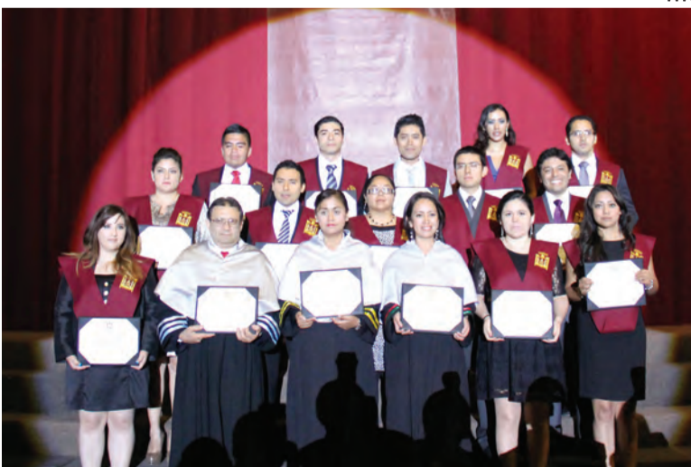
Premio Abelardo Sánchez Gutiérrez