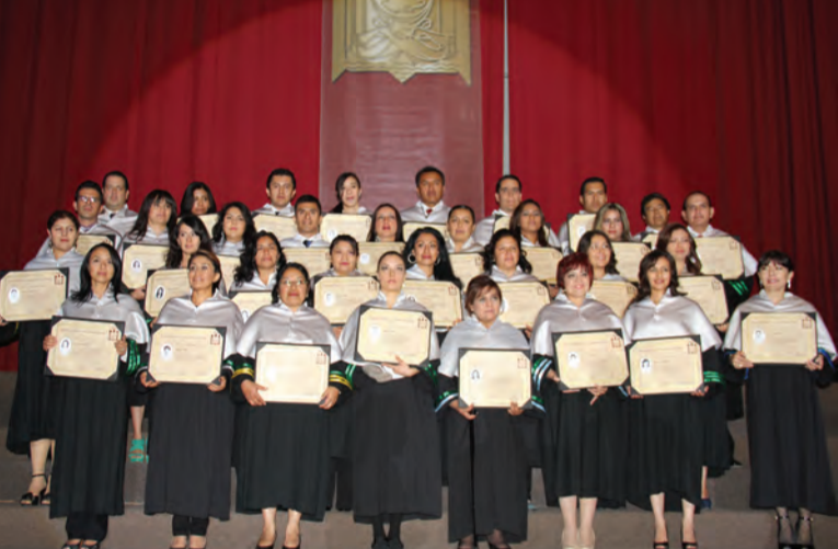
Posgrado Económico Administrativo