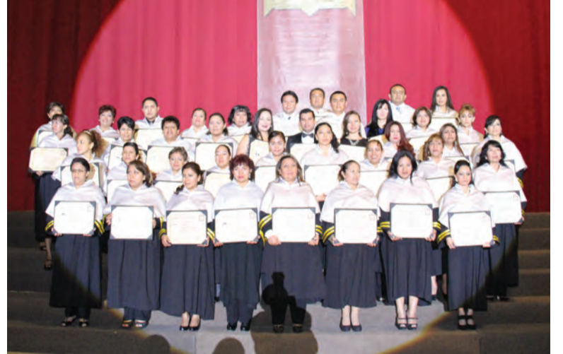
Posgrado en Ciencias de la Salud