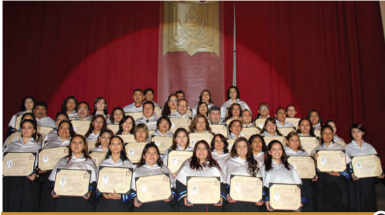
Posgrado en Artes y Humanidades