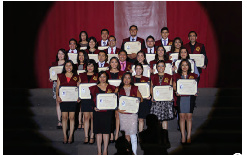
Odontología y Enfermería