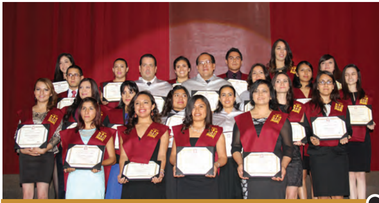
Premio Abelardo Sánchez Gutiérrez