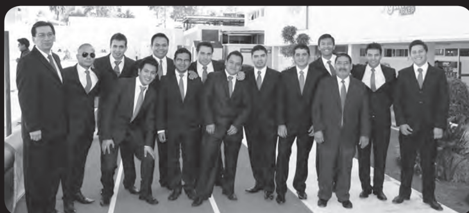
Manufactura de Autopartes