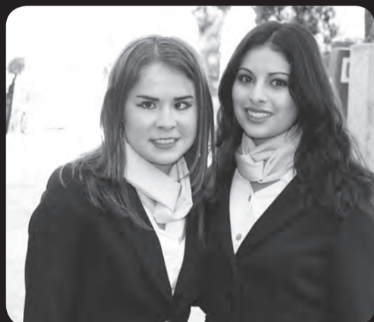
Flor, Ellilhian Biotecnología