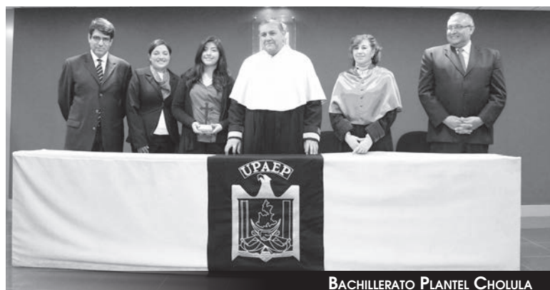
BACHILLERATO PLANTEL CHOLULA