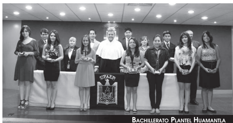
BACHILLERATO PLANTEL HUAMANTLA