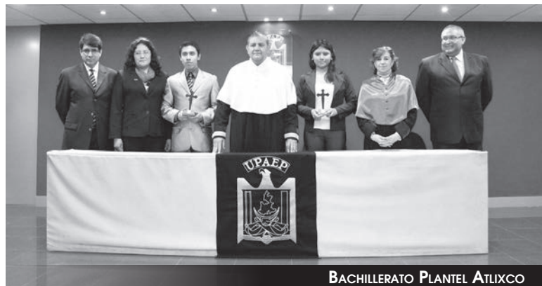
BACHILLERATO PLANTEL ATLIXCO