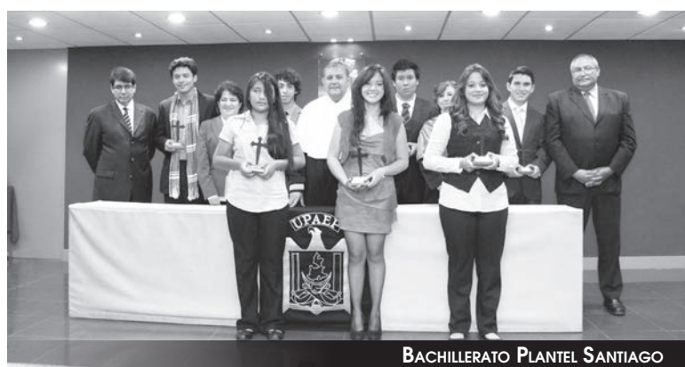
BACHILLERATO PLANTEL SANTIAGO