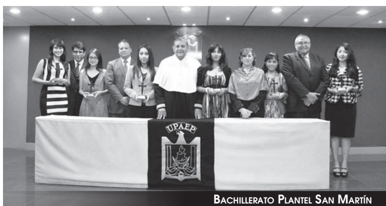
BACHILLERATO PLANTEL SAN MARTÍN