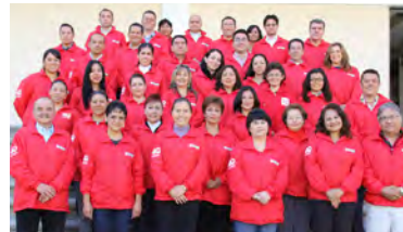
Catedráticos de la Facultad de Odontología.