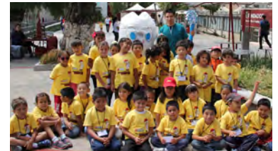
Socializando en el Campamento de Verano.