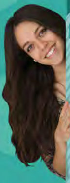
Alumno de Licenciatura Psicopedagogía