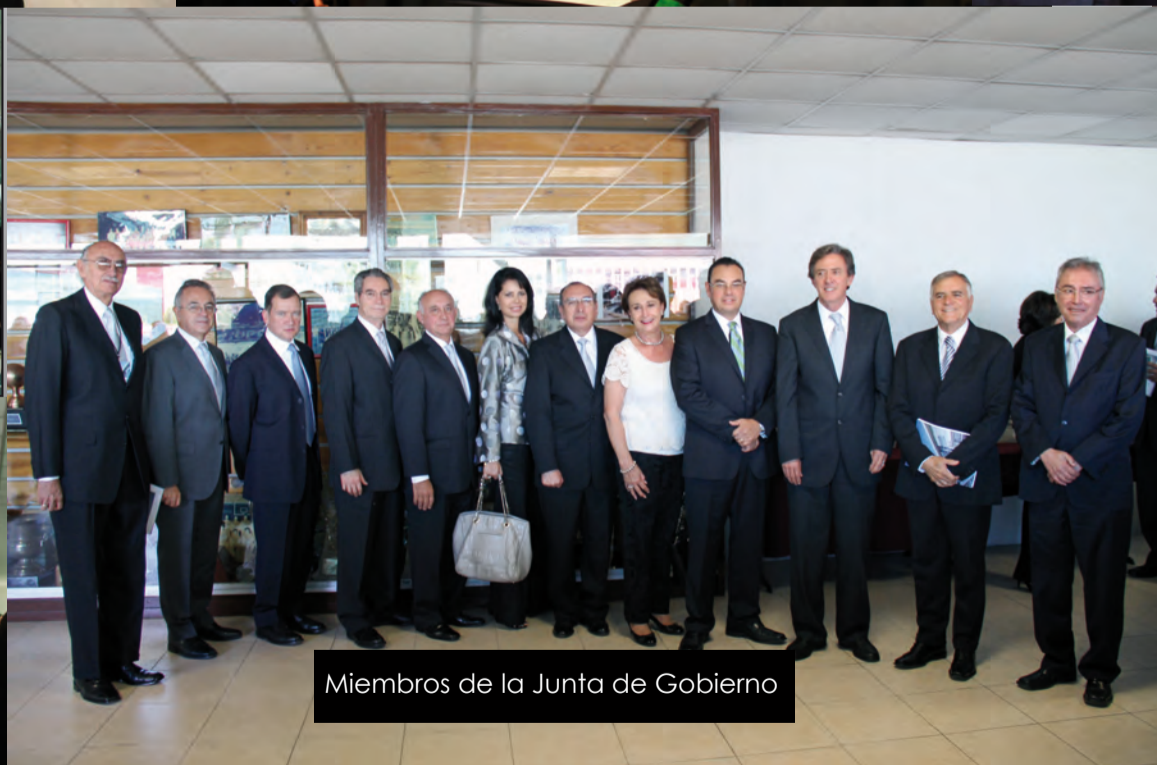
Miembros de la Junta de Gobierno