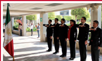
Departamentos de Servicios, Odontología, Biblioteca y Operaciones

En el acto cívico se hizo hincapié en estar orgullosos de nuestro Lábaro Patrio, ya que representa a un país mestizo que lucha por ser mejor; una nación con historia, tradiciones y cultura que pueden transformar el futuro. (En esta página, estimado lector encontrará el discurso completo).