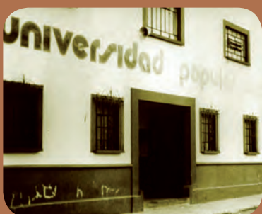
Adquisición de los edificios de la 9 poniente 1517 y de la 11 poniente 1308

En las primeras páginas del periódico El Universitario del 17 de enero de 1977, (número 00) se daba a conocer la puesta en marcha de la Maestría en Administración de Empresas. Y a la letra dice: “El pasado 10 de enero de 1977 dio comienzo el programa de maestría de Administración de Empresas, en nuestra universidad, que se realiza por semestres.