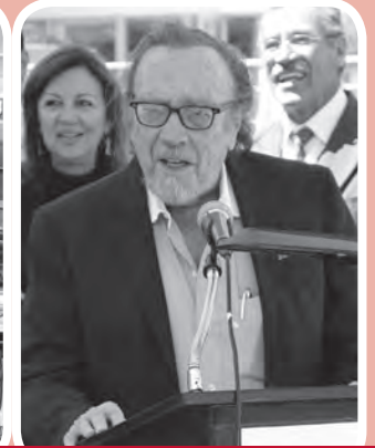
Se inauguró escultura conmemorativa de los 40 años de la UPAEP.