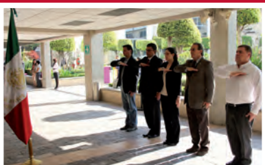
Departamento de Arte y Humanidades