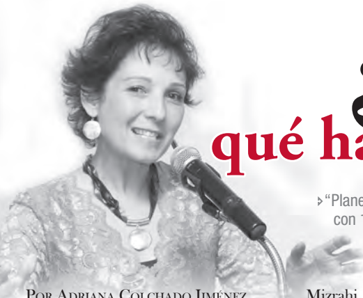
POR ADRIANA COLCHADO JIMÉNEZ

En la entrega del 2012 destacó en el rubro que nos interesa, el de los libros, el film "La chica del dragón tatuado", historia proveniente de la primera novela de la trilogía "Millennium" del escritor sueco Stieg Larsson. Esta trilogía contiene los títulos: "Los hombres que no amaban a las mujeres", "La chica que soñaba con una cerilla y un bidón de gasolina" y "La reina en el palacio de las corrientes de aire." Estas novelas fueron publicadas del año 2005 al 2007 y tienen una trama policíaca, en donde, un periodista que acaba de perder su reputación, es contratado por un viejo empresario que le pide revelar el misterio del asesinato de su sobrina.