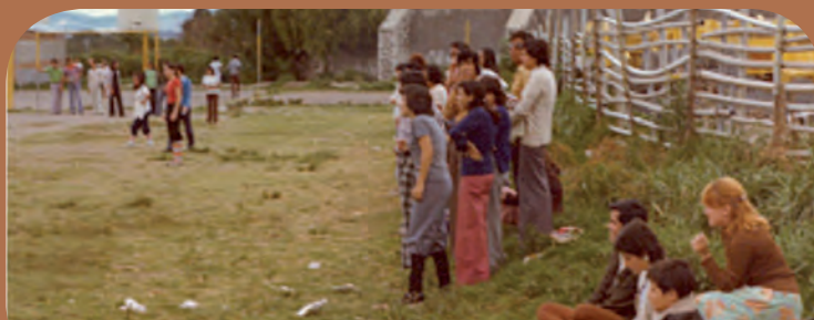
Partido de futbol en el Exrancho la Noria