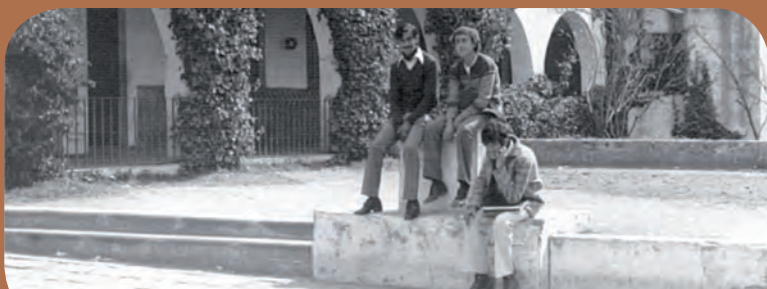
Instalaciones del Exrancho la Noria