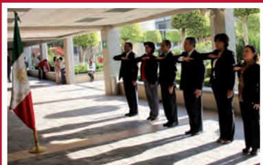
Dirección General de la Plataforma Tecnológica del Sistema