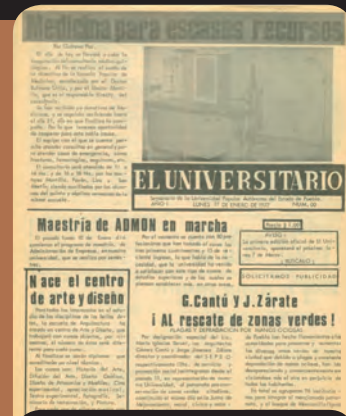
El Universitario número 00

“En el primer número oficial, aparecerá toda la información que necesita el estudiantado lector, con todas las características necesarias para ejercer un auténtico periodismo universitario; no te lo pierdas, búscalo antes de que se agote por solo un peso, el ejemplar”.