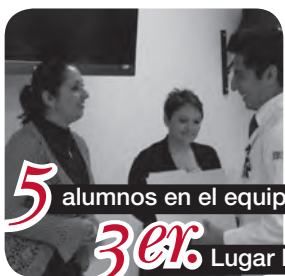
5 alumnos en el equipo. 3er. Lugar Nacional.

Obtienen esta distinción en Competencia Nacional de Simulación Médica.