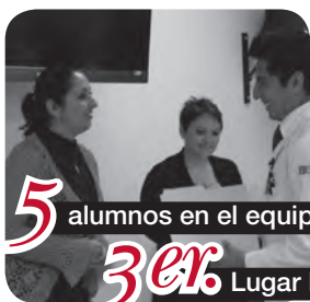
5 alumnos en el equipo. 3er. Lugar Nacional.

Obtienen esta distinción en Competencia Nacional de Simulación Médica.