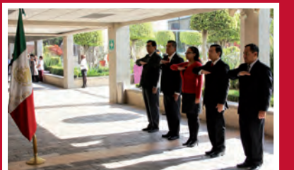
Departamento de Ingenierías