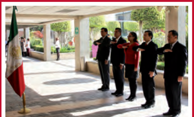
Departamento de Ingenierías