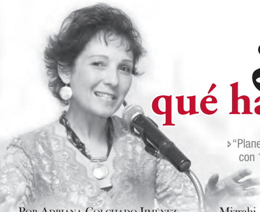
POR ADRIANA COLCHADO JIMÉNEZ

En la entrega del 2012 destacó en el rubro que nos interesa, el de los libros, el film "La chica del dragón tatuado", historia proveniente de la primera novela de la trilogía "Millennium" del escritor sueco Stieg Larsson. Esta trilogía contiene los títulos: "Los hombres que no amaban a las mujeres", "La chica que soñaba con una cerilla y un bidón de gasolina" y "La reina en el palacio de las corrientes de aire." Estas novelas fueron publicadas del año 2005 al 2007 y tienen una trama policíaca, en donde, un periodista que acaba de perder su reputación, es contratado por un viejo empresario que le pide revelar el misterio del asesinato de su sobrina.