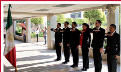
Departamentos de Servicios, Odontología, Biblioteca y Operaciones

En el acto cívico se hizo hincapié en estar orgullosos de nuestro Lábaro Patrio, ya que representa a un país mestizo que lucha por ser mejor; una nación con historia, tradiciones y cultura que pueden transformar el futuro. (En esta página, estimado lector encontrará el discurso completo).