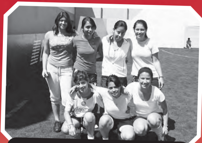
Atlético Doña Pancha