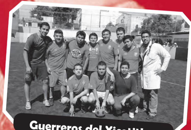
Guerreros del Xicotitlan