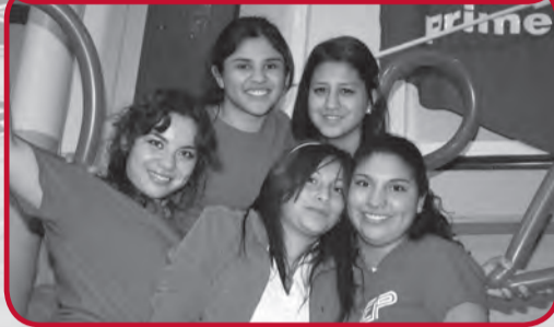
Derecho y Comercio