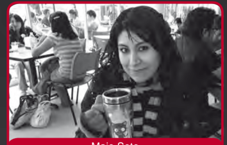
Majo Soto Comunicación