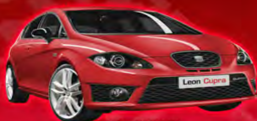
PRIMER PREMIO SEAT León Cupra 2010

ESTE Jueves 13 de mayo de 2010 TE INVITAMOS A ASISTIR AL SORTEO CUATRO DE UPAEP 2010