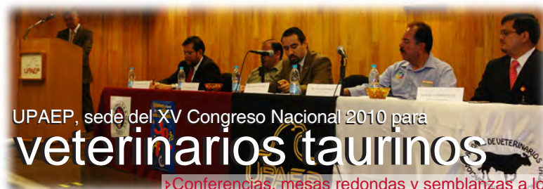
UPAEP, sede del XV Congreso Nacional 2010 para

Agradecemos a todos por habernos permitido entrar en sus proyectos y contar con el apoyo y participación de todos los interesados.