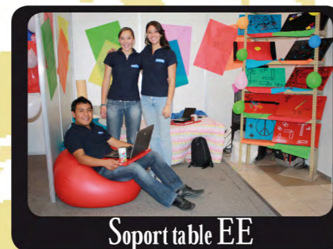
Soport table EE

Viernes, Sábado y Domingo de 7 a.m. a 3 p.m.