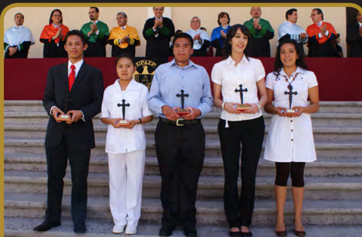
Departamento de Ciencias de la Salud