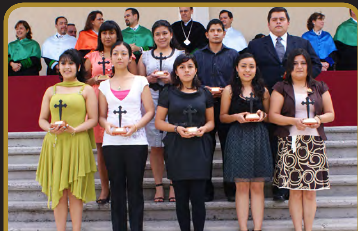
Departamento de Ingenierías