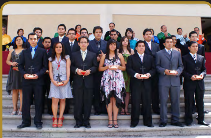
Departamento de Ingeniería y Tecnologías de Información