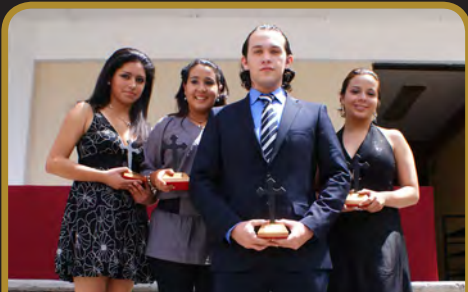
Colaboradores de Prensa y Comunicación