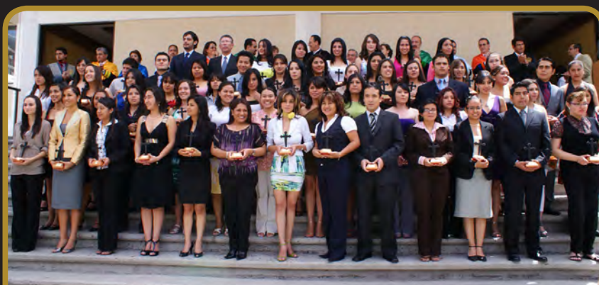
Departamento de Ciencias Económico-Administrativas