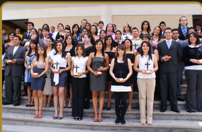
Departamento de Diseño, Arte y Arquitectura