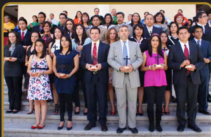
Departamento de Ciencias Sociales