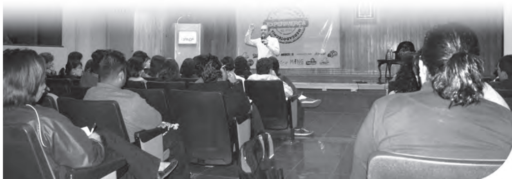
Participaron alumnos de diferentes carreras como Mercadotecnia, Diseño Gráfico, Diseño y Producción Publicitaria, Administración de Instituciones, Periodismo, entre otras.