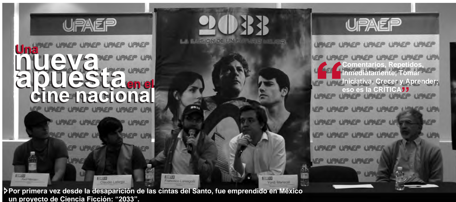
► Por primera vez desde la desaparición de las cintas del Santo, fue emprendido en México un proyecto de Ciencia Ficción: "2033".