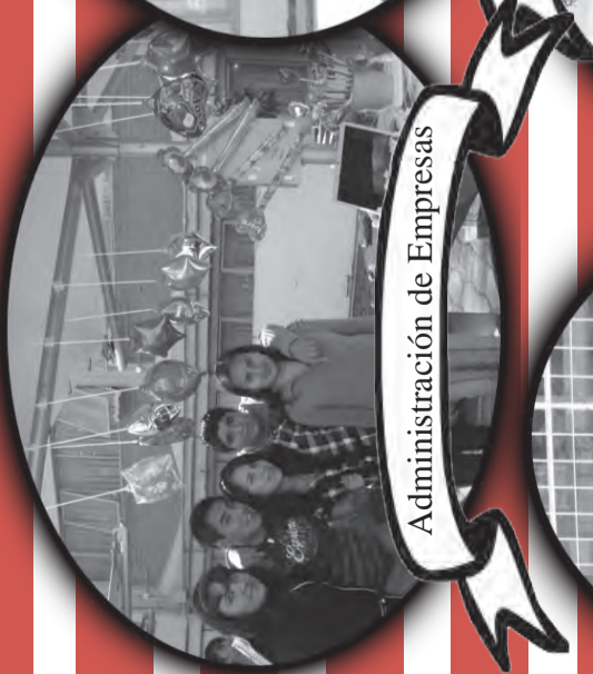
Administración de Empresas