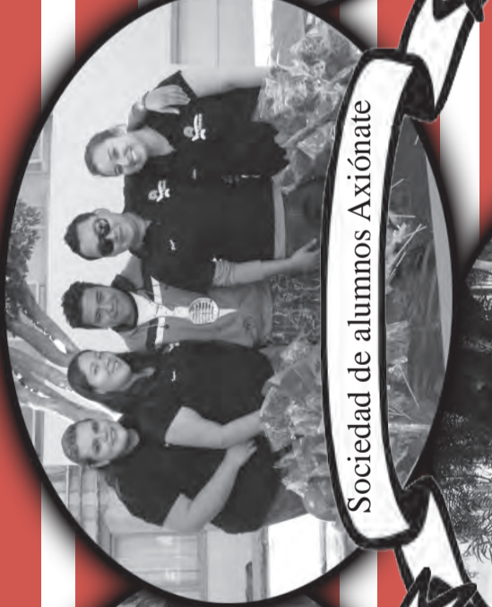
Sociedad de alumnos Axionate