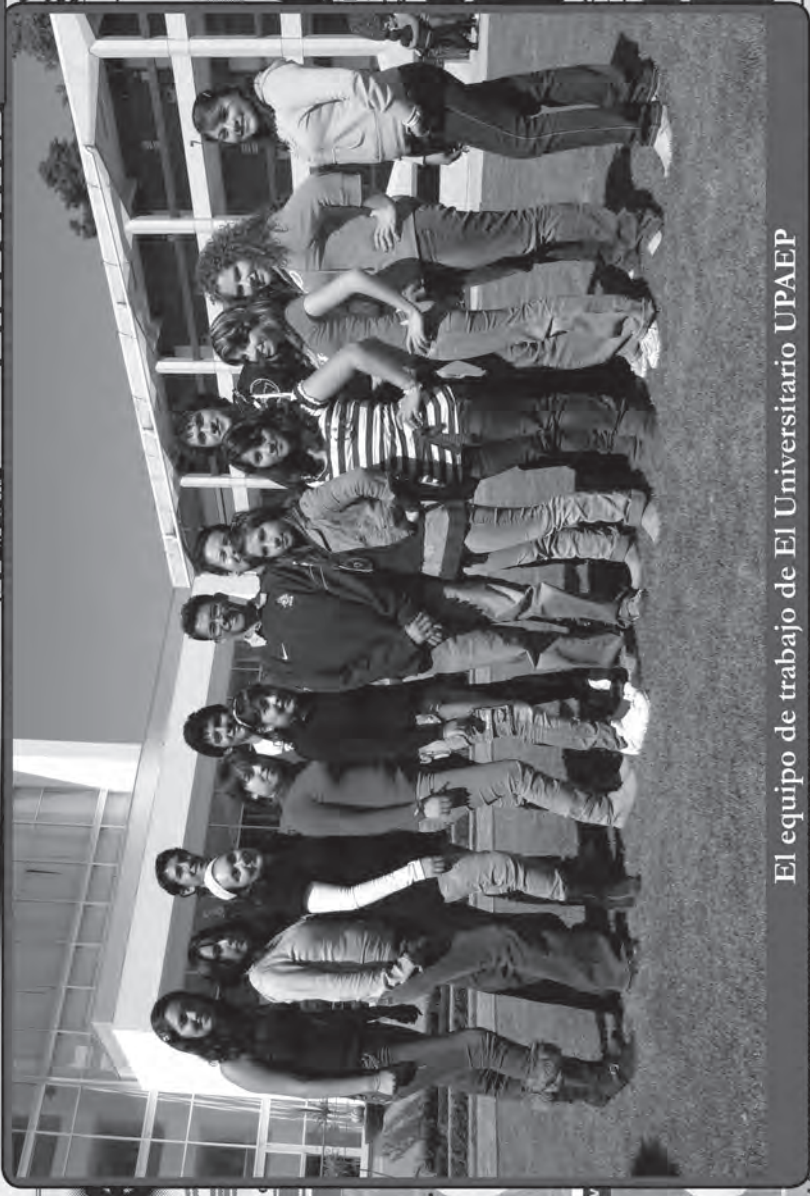
El equipo de trabajo de El Universitario UPAEP