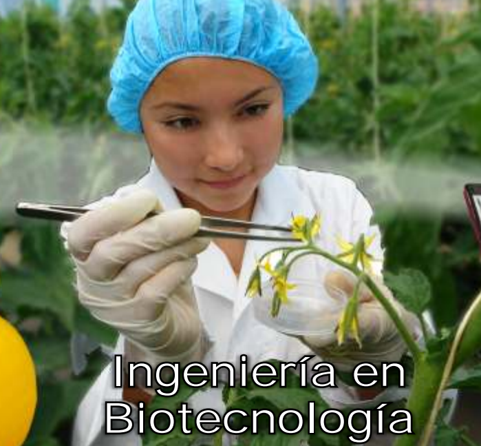
Ingeniería en Biotecnología