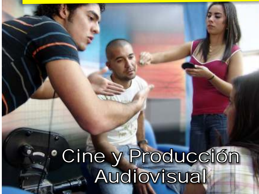
Cine y Producción Audiovisual