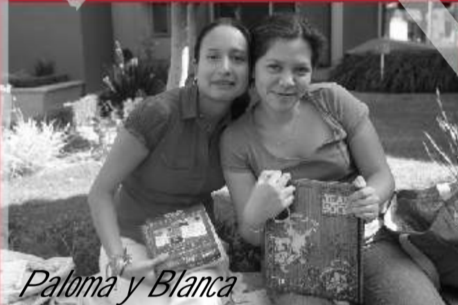
Paloma y Blanca