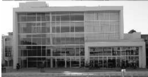
La internacionalización de los alumnos, una prioridad para la universidad.