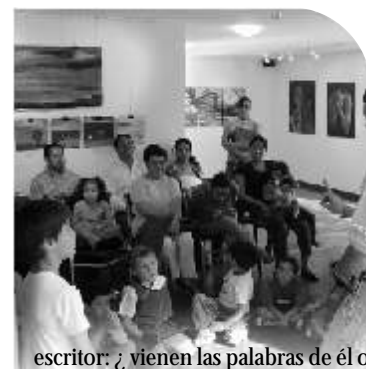
escritor: ¿vienen las palabras de él o le son enviadas desde fuera?

Teodoro Esturió, el escritor del cuento del escritor de mi cuento, obedece al que lo escribe sin darse cuenta alguna de que es manipulado. Simplemente escribe. Siente que las palabras vienen de su interior, que nacen en su cerebro para posteriormente deslizarse por su espalda, cargar sus brazos de significados para desparramarlos a través de sus manos. El personaje de mi personaje escribe, pero cuando decide dejar de hacerlo se da cuenta de que es imposible. Continúa pulsando teclas, llenando la página de caracteres negros. Es entonces que lo