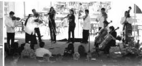
La penúltima presentación corrió a cargo de Dj Waza y concluyó con la Banda Atómic.

Posteriormente se presentó el grupo integrado por universitarios GMU con temas de rock pop de los 80's, por espacio de una hora; continuó el grupo de rock alternativo Flicka, quienes tocaron covers de Alex Sintek, Moenia, Emanuel, Timbiriche y Soda