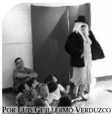
POR LUIS GUILLERMO VERDUZCO

Me veo escribir un cuento. Desde fuera, puedo verme escribiendo. Estoy sentado frente al teclado de mi computadora, mis manos pulsando las letras, creando palabras por aglutinación. El cuento fluye a través de mí, viene desde fuera, mis dedos se mueven por un impulso externo, crean un cuento: el cuento me usa, usa mis manos para derramarse en la página, liberado. Una pianola humana, trabajando en automático, sin participación alguna.