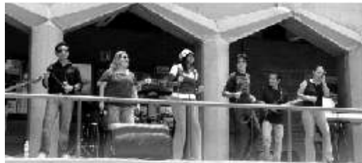
importante para la Universidad como lo es el 35 aniversario.