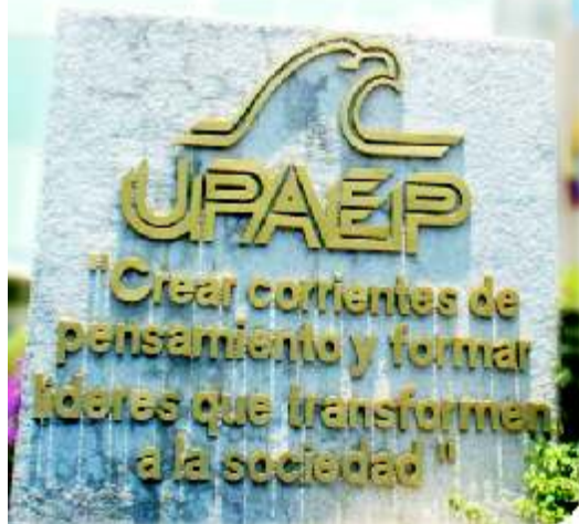
Instalaciones del Campus Central.

El mismo 7 de mayo se realizará la presentación de cinco grupos musicales que amenicen durante el día, y por la noche, un concierto de Camerata en Movimiento, asimismo se realizará alrededor del mes de septiembre la presentación de las Orquestas Sinfónicas de la UNAM y de Xalapa, con la finalidad de continuar en lo que resta del año la celebración de tan importante fecha.