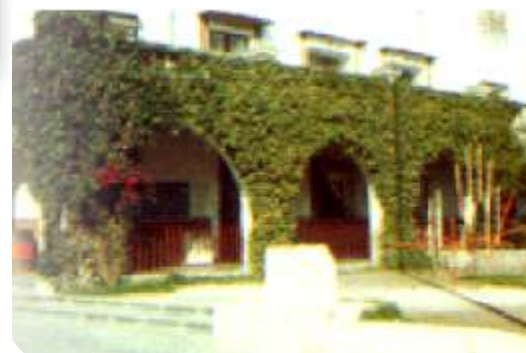
En las instalaciones de la ex hacienda la Noria comenzó sus labores la universidad.

“La UPAEP surgió como una opción distinta dando a quienes aceptaron el reto de desprenderse de las dos únicas opciones de educación pública, una formación integral y preocupada por el aspecto humanístico de la persona”.