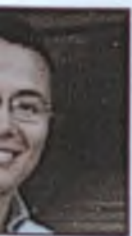
la García Edición Información