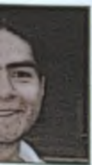
Sainos Mendieta Comunicación Externa