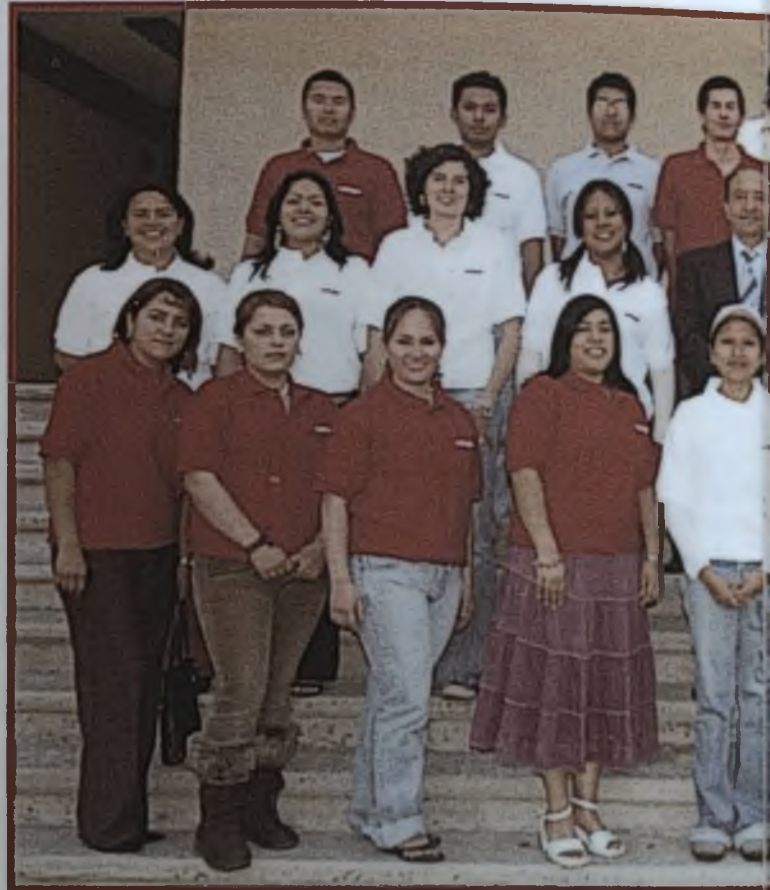
El equipo de "E"