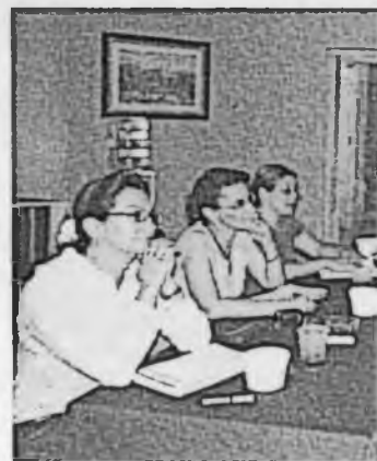
Académicos y alumnos participan en el curso.

"El cine es considerado como el séptimo arte, mediante el cual se cuentan las más maravillosas historias, todo respaldado por un gran equipo de producción, el cual ve reflejado su tra-