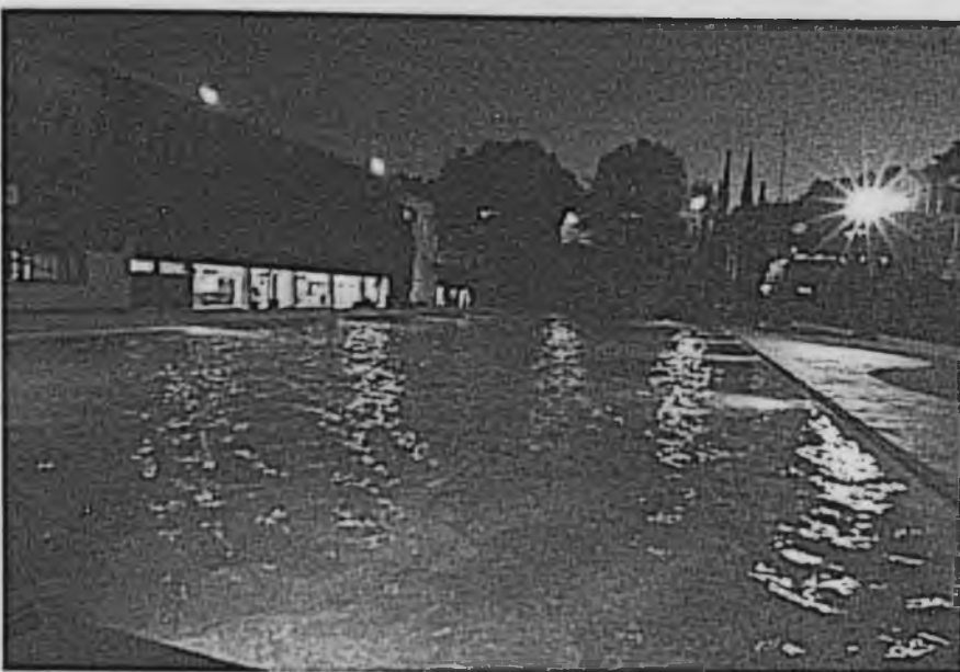
Ya se prepara la "fiesta deportiva" con el evento Dual Meet, que se iniciará contra el Tec. de Monterrey, Campus Edo. de México.

“El 15 Marzo será la gran inauguración.”