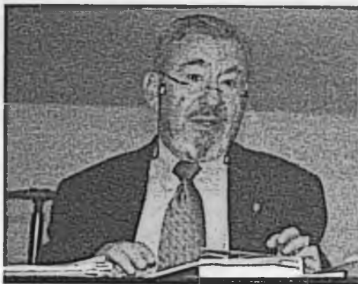
Es insuficiente la cantidad de productores de café en México.

En su intervención, Cantú Peña reveló que en México existen únicamente 480 mil productores de café, lo que resulta insuficiente para competir con países