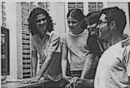
La familia núcleo de formación de cada ciudadano.

En la familia se construyen un conjunto de relaciones interpersonales, que no necesariamente son fáciles