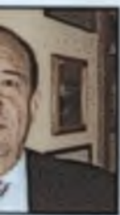
Argüelles R. N. Relaciones UPAEP