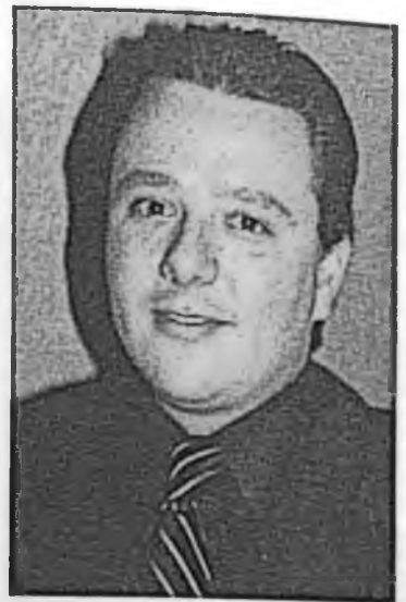
Se pretende este año incorporar la tercera generación en los equipos celulares.

"Actualmente se han mejorado los servicios en cuestión de telefonía en la capital y se espera implementar más avances", aseveró Salmerón Franco.