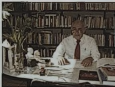
El universitario, un medio que ha trascendido.

Yo creo que en la comunidad sí; claro que existen diferentes periódicos universitarios en otras instituciones que son menos el enlace entre la comunidad y más expresión de algún grupo o de alguna forma de pensar. El Universitario tiene su riqueza, me gusta la idea de un medio de comunicación que enlace a la universidad. El periódico tiene que estar vinculando las actividades y debe ser la expresión de la