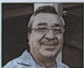
José Notano Moya Fotografía