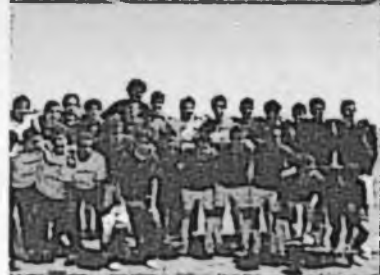
Solo 5 fueron los calificados para el CONDDE.