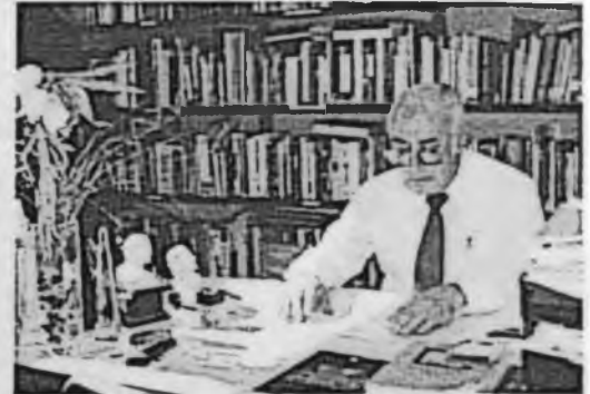
La ética es un problema central ante la preocupación que se vive en un mundo globalizado.