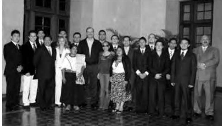
Ganadores del Premio Nacional de la Juventud 2005.