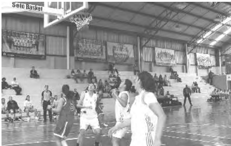
Las ÁGUILAS de la UPAEP en búsqueda de emprender el vuelo.

“En el básquetbol como en cualquier deporte, nada está escrito, tenemos que aprender a mantener la concentración