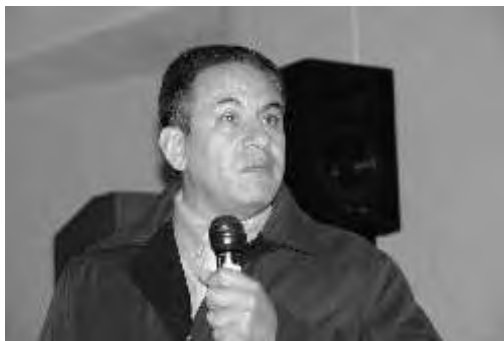
El Budismo ha trascendido a través de los siglos

El Budismo tiene su origen en la religión madre, considerada una de las más antiguas de la humanidad, la Hindú, misma que tiene una existencia que se remonta a 300 años A.C. Buda, a pesar de profesar esta religión, concibe otra forma de "ver la vida y la muerte" y al mismo tiempo no se concreta a una deidad en particular, por ello, sus seguidores no la