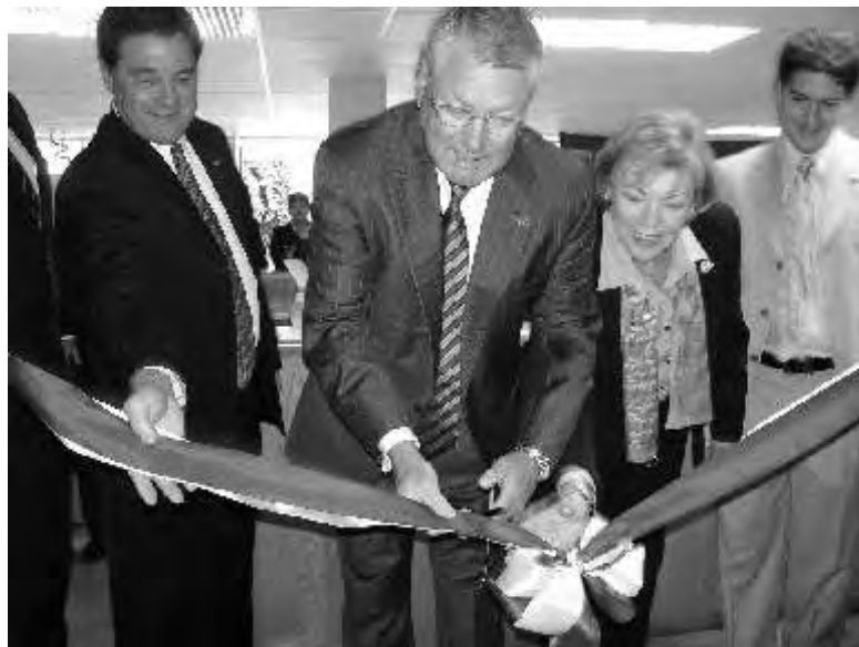
Inauguración de oficinas de la OSU en la UPAEP

Un reto lleno de desafíos y de intereses en común que pueden fortalecer a ambas instituciones mexicanas y a la OSU con la apertura de oficinas en el Estado de Puebla es la opinión que expresó, Vladimir Sambaiew, Ministro Consejero para Asuntos Económicos de la Embajada de Estados Unidos, quien coincidió en que la apertura académica de las dos culturas enriquecerá la actividad académica de ambos países.