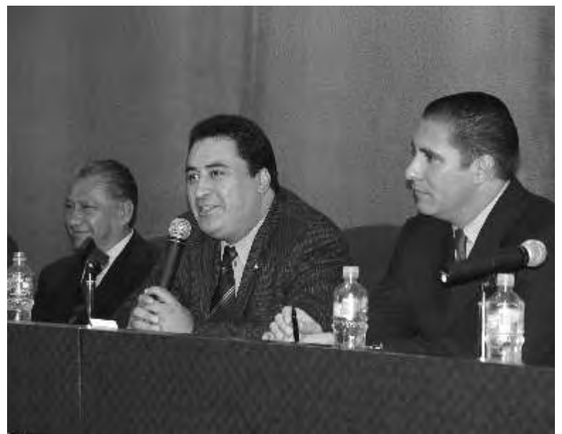
Senadores a favor de la nueva reforma política de México

Durante la sesión de preguntas y respuestas, se les cuestionó si es necesario un cambio total a la Constitución, a lo que los Senadores respondieron que no hace falta, ya que han existido reformas