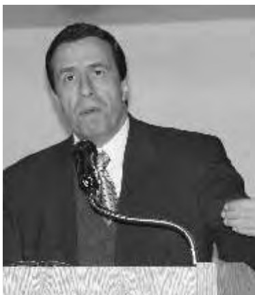
El Dr. Arturo Damm Arnal, habló de las expectativas económicas de México

ma devaluatorio, aseguró el doctor en economía Arturo Damm Arnal, durante el desayunoconferencia titulada "Perspectivas económicas y políticas de México en el 2006", organizada por el departamento EXA-UPAEP.