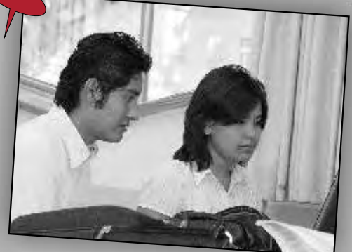
Aron Jimenez Carrillo e Oras Castillo Arquitectura