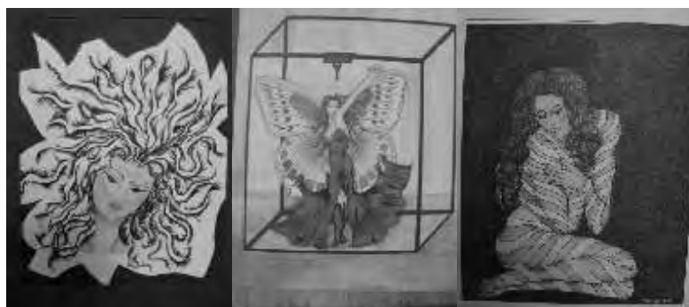
“Todo lo que plasmo hace referencia al ser humano”

Plumón de agua y óleo, son las técnicas que utilizó el autor, el artista desea que sus obras despierten en los jóvenes la curiosidad por el oficio, de tal manera que, quien vea la obra diga: “me gustaría hacer algo así”, a la vez su interés es conocer la opinión de los universitarios. “El movimiento de la vida” permanecerá en la sala de usos múltiples del Culturarium hasta el 15 de febrero.