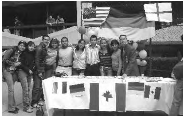
Alumnos de diferentes licenciaturas invitan a sus compañeros a conocer las oportunidades que hay de estudiar en el extranjero