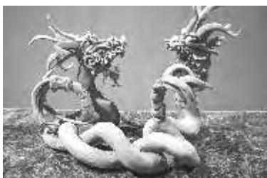
Escultura de Quetzal-coatl puesta en Museo UPAEP

El artista explicó que las esculturas, inspiradas en las leyendas que existen sobre el dios prehispánico Quetzalcóatl, tienen el objetivo de lograr que los espectadores se identifiquen con la fuerza reflejada por las piezas y experimenten el sentimiento de ser “observados por un dios Quetzalcóatl”.