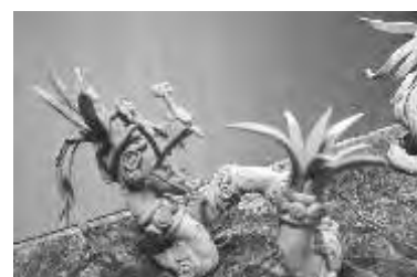
Figuras de terracota con detalles en oro y mármol