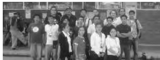
Estudiantes de tecnologías de información

Este Encuentro reúne anualmente a la creciente comunidad de usuarios de Linux de nuestro país, con el fin de compartir experiencias, presentar trabajos de investigación y aumentar y consolidar el número de usuarios de Linux.