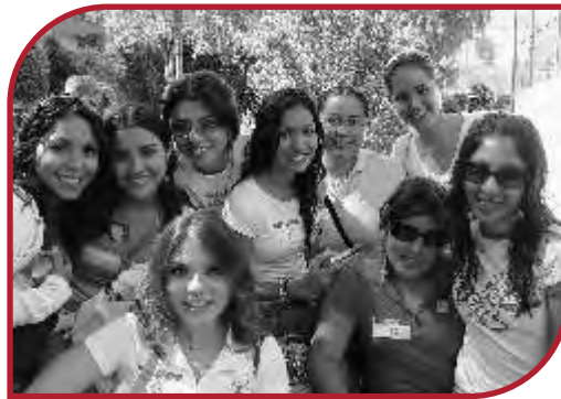
Grupo de Villahermosa