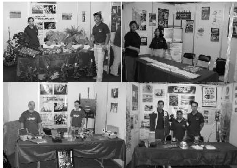
Stand de información durante la vivencia vocacional