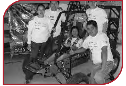
Estudiantes de Manufacturas y autopartes presentaron su auto de Mini-baja