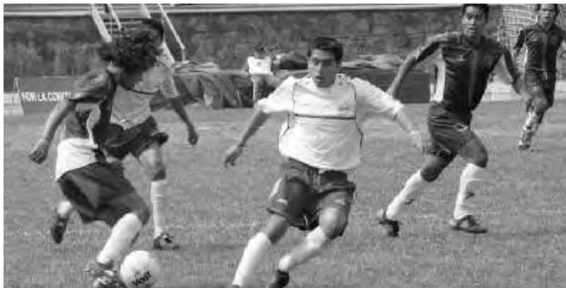
Las Águilas continúan en la cúspide del torneo

Este encuentro representó el último compromiso dentro de la Liga Ibérica para las Águilas, por lo tanto, su participación queda enmarcada en 10 juegos ganados y un empate a ceros, dentro de las 11 jornadas que reunió a equipos como: Trujillo soccer, Dukla, Interespañol, Lazio, Felgo, Seat, Plus