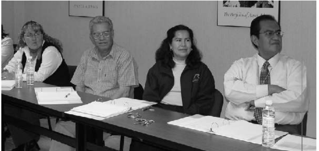
Catedráticos de la Universidad del Valle del Altiplano, de la Universidad del Valle de Tlaxcala y del departamento de Administración y Contaduría de la UPAEP, recibieron el curso de "Formación de Evaluadores para la Acreditación"