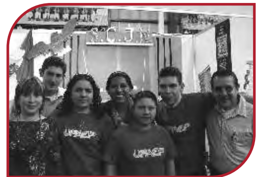
Facultad de Derecho (UPAEP)