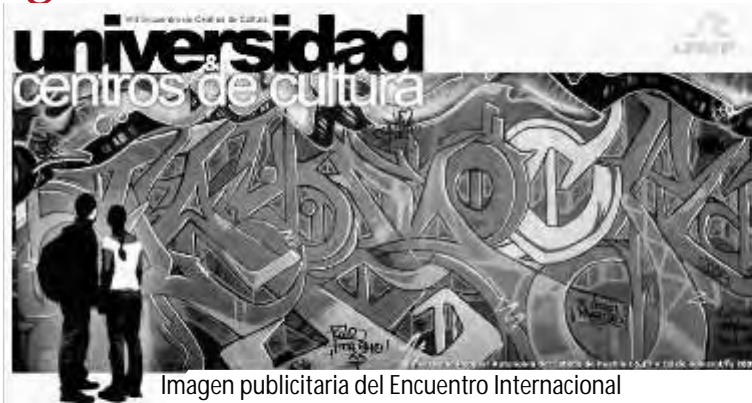
Imagen publicitaria del Encuentro Internacional