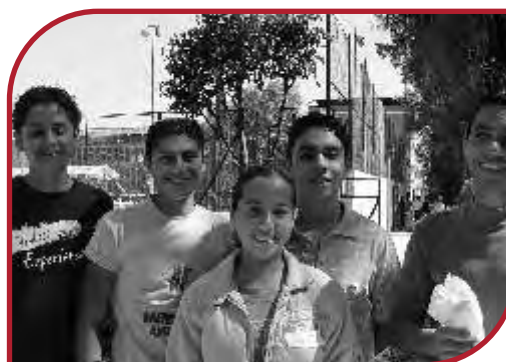
Grupo de Guerrero