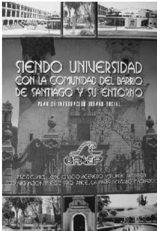
La portada de la investigación

El desarrollo social pretende buscar el mejoramiento de la calidad de vida; el urbano, la integración funcional y la estructura urbana de la ciudad mediante la adecuada distribución de los usos de suelo en la zona; en lo económico, se busca incentivar inversiones que permitan la coexistencia de usos en la zona mediante la normatividad de usos de suelo; en lo ambiental, se