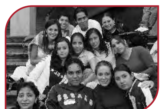
Grupo de Orizaba