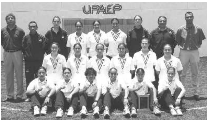
El representativo de fútbol rápido femenino destacó en el nacional de Conadeip

La Universidad del Valle de Atemajac (UNIVA) como coordinadora de la disciplina dispuso de las instalaciones de la Cancha Patria para realización del torneo. El arbitraje corrió bajo la responsabilidad de jueces afiliados a la Federación Mexicana de Fútbol Rápido. Las instituciones participantes fueron la UDLA, el ITESM Monterrey, la Universidad del Valle de México (UVM) campus Querétaro, ITAM, la UVM campus Estado de México, la UNIVA y la UPAEP, las primeras cuatro se concentraron dentro del grupo A y el resto en el B.