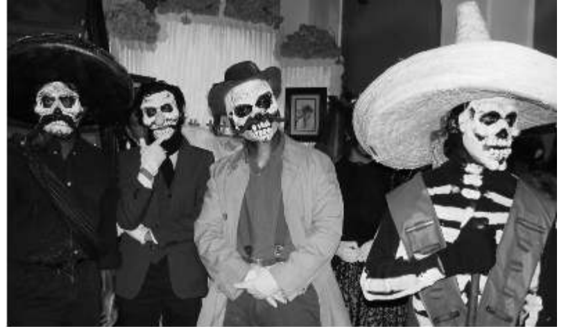
Calaveras de Villa, el Catrín, el Macho y Zapata