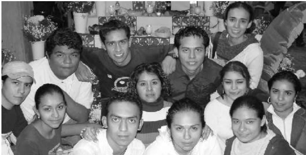
El equipo triunfador: integrantes del GIPS, ganadores de 8 mil pesos