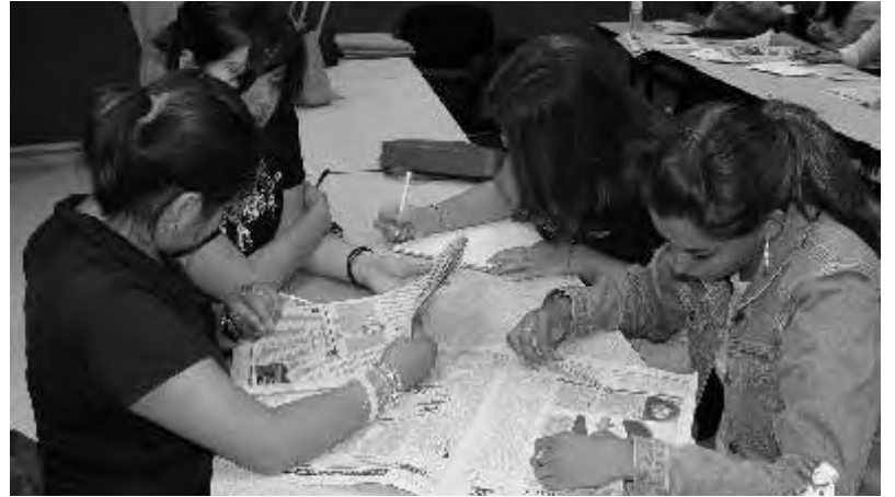
Estudiantes de primero, quinto, séptimo y noveno semestre de las carreras de Ciencias de la Comunicación y Periodismo, fueron los receptores de este curso

Sin embargo, en la actualidad puede hablarse de una relación desfasada entre la imagen y la realidad, porque en los últimos años han sucedido importantes cambios en la sociedad y en la vida concreta de hombres y mujeres en el mundo. Estos cambios han originado nuevos entretrejos en la vida de éstas, pues han ido tomando lugares, haceres y propuestas que no son reflejados en los medios y con frecuencia son fustigados,