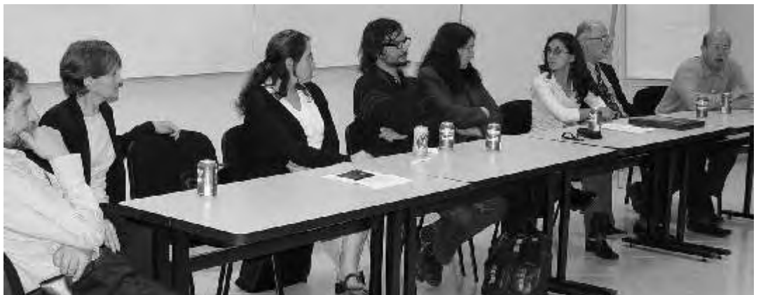
Durante la mesa redonda de Historia del Diseño en América Latina, actividad organizada por Centro de Estudios Avanzados de Diseño, Grupo Nodo Diseño América Latina (NODAL) y la UPAEP

Tras comparar el diseño con las referencias de