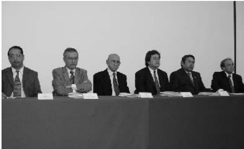
Los módulos fueron dirigidos por catedráticos de la Universidad y miembros del Nosocomio

Los puntos tratados en el taller se dirigieron a la división de la ansiedad normal y patológica, las diferentes clasificaciones de ansiedad, el