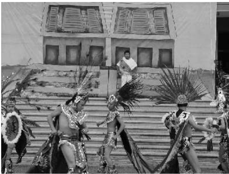
Conjunto de guerreros aztecas que realizan una danza después de la cual desaparecen del mismo modo que aparecieron