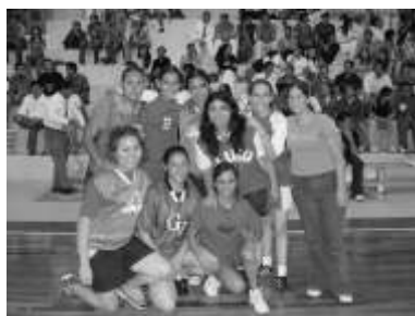
1er lugar femenil

Un día después de la final, arrancó el intramuros de baloncesto en el que se encuentran registrados 12 equipos en la rama varonil y 8 en la femenil, los cuales dentro de su grupo se disputaran entre sí el pase a la gran final prevista para el jueves 27 de octubre. Los cuartos de final dentro de la rama varonil se definirán el día 25, y el 26 se efectuarán las semifinales en ambas ramas.