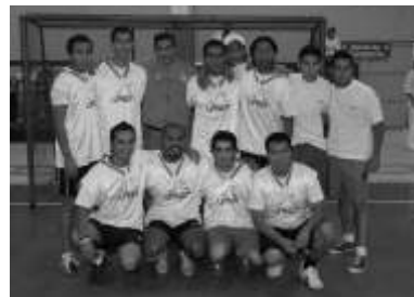
1er lugar varonil