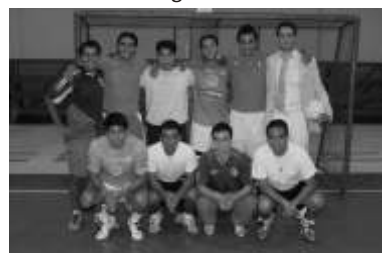
2do lugar varonil