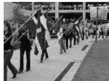
Banderas pertenecientes a cada uno de los países del Continente Americano

evidente deseo de, bailar se adueña de la escena un grupo de bailarines, representando diversos estados de la República Mexicana. Posteriormente desde una esquina, brotan una por una, las banderas pertenecientes a cada uno de los países de América, siendo acompañadas por las dos naciones que dan origen a este continente: México y España.