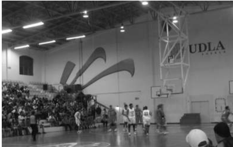
Con 21 puntos la UPAEP derrotó a la UDLA

Para las Águilas éste fue el noveno compromiso, siete de visitantes y dos como locales dentro de la justa de la CONADEIP, contabilizando hasta el