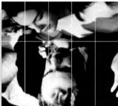
Buñuel logró la fama a nivel mundial por el género surrealista