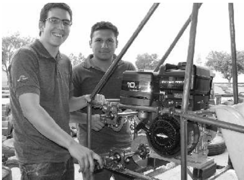
Estudiantes de los últimos semestres de la carrera de Ingeniería en Manufactura de Autopartes de la UPAEP, diseñan vehículo de Minibaja, como parte del proyecto que representará a la Universidad en la competencia internacional que realizará la Asociación Internacional de Ingenieros Automotrices

Uno de los méritos que es importante destacar para la elaboración de este vehículo, es que el diseño teórico lo iniciaron desde hace un año, arrancando su elaboración física desde el pasado