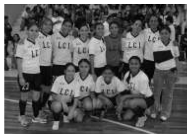
2do lugar femenil