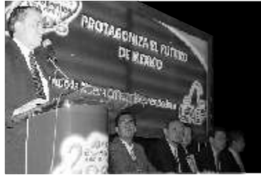
Durante la inauguración del 2o. Congreso Económico-Administrativo

“Alrededor de 18 meses la Universidad ha trabajado para forjar lo que es la Visión 2015. En esa Visión 2015, se marca como lo más importante que la