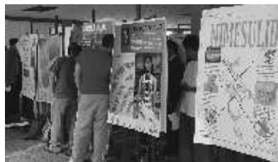
Los carteles participantes en exposición

Los valores que deben existir en la relación médico paciente fueron la temática en base en que se fundamentó la presentación de los gráficos, un trabajos realizados por alumnos de cuarto semestre de Medicina de la UPAEP en conjunto con el grupo de Estudiantes Universitarios por la Vida (EUVIDA) y profesores que imparten la materia de Bioética. Por tercera ocasión, la presentación se efectuó en la