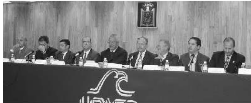
Empresarios, juristas, especialistas en seguridad pública, funcionarios públicos y académicos participaron en la Primera Mesa Redonda de la Piratería