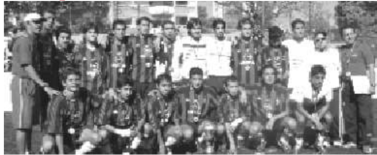
La estampa del representativo vencedor

Las águilas obtienen así el triunfo de campeones de la Universiada Nacional 2005, además de abrirse la posibilidad de