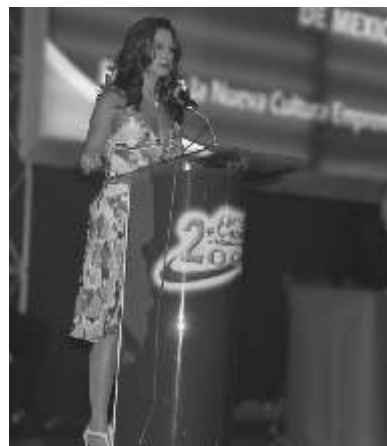
La ex-miss universo

la invitaron a participar en el certamen nacional de belleza como una empresa, asumió que un gran compromiso, pues no sólo se trabajan seis meses sino un año,