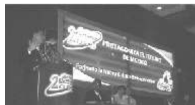
Carlos Abascal Carranza, Secretario de Trabajo

Refirió que México necesita personas competentes para conformar un estado igualmente competente, por lo tanto, afirmó que la sociedad se debe exigir una actitud de excelencia, responsabilidad y liderazgo, para de esa forma convertir los conocimientos teóricos en empleos.