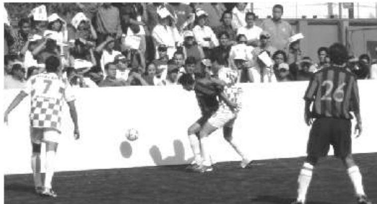
Con una ráfaga de goles el equipo de los Gole Toys se adueñó del campeonato