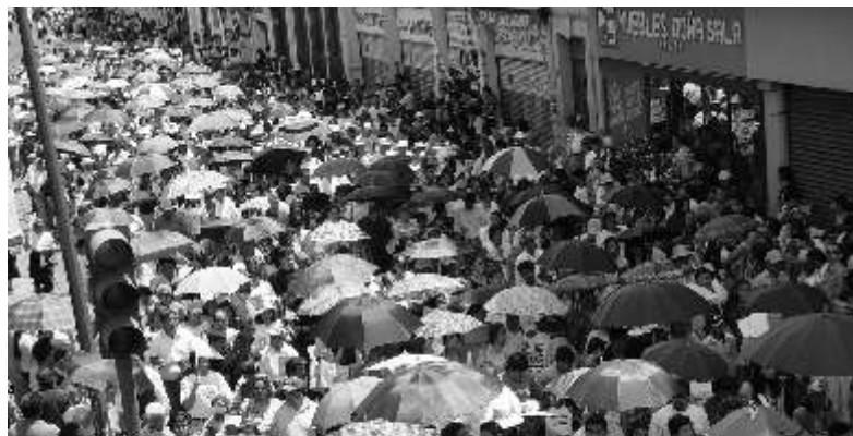
Llegado el medio día, se dieron cita los creyentes en el atrio

El líder de la grey católica consideró que el hombre es peregrino porque le gusta visitar los lugares claves de su