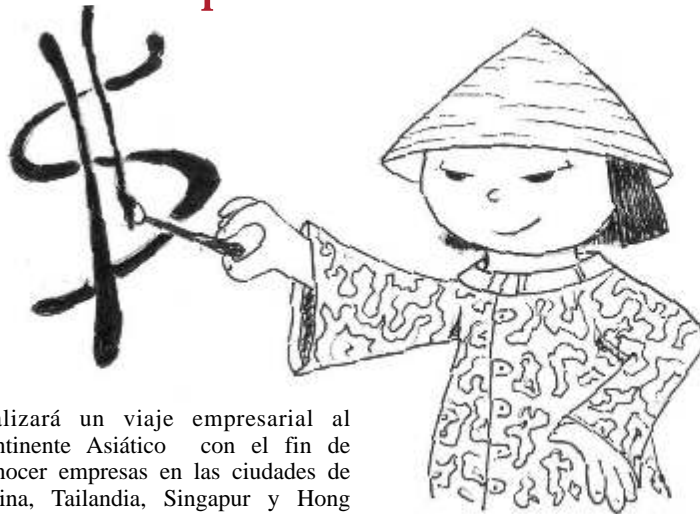
Ilustración: Ma. José Nájcher Sol la lande

realizará un viaje empresarial al continente Asiático con el fin de conocer empresas en las ciudades de China, Tailandia, Singapur y Hong kong.