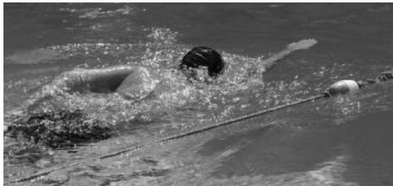
El representativo de natación compitió contra equipos de prestigio

Larios Hernández aseveró que los 45 alumnos, --veinte del equipo y el resto del pre-equipo se encuentran “muy bien preparados”, además de que son disciplinados y constantes en la práctica del deporte.