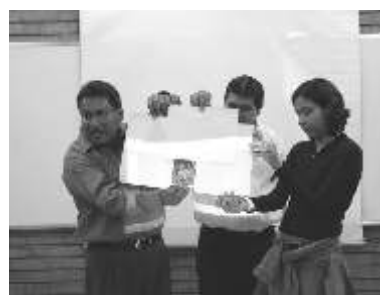
Es necesario impulsar el fotoperiodismo