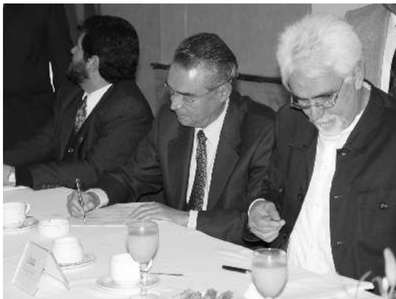
En el acuerdo firmado por el GIPS se establece unificar esfuerzos y desarrollar programas y recursos en materia de desastres y de desarrollo sustentable

Fue en el año 1997, cuando el Centro Universitario para la Prevención de Desastres Regionales (Cupreder) de la BUAP convocó a Rectores y Directores de las principales Instituciones de Educación Superior de la entidad, a formar parte del Grupo de Trabajo de Participación Social, como una entidad interlocutora del gobierno del estado para discutir, decidir y encaminar, desde antes de una probable emergencia ocasionada por la actividad del Volcán Popocatepetl, reconociendo los aportes que la sociedad como son el acopio de ayuda, la instauración de albergues o refugios temporales, entre otros;