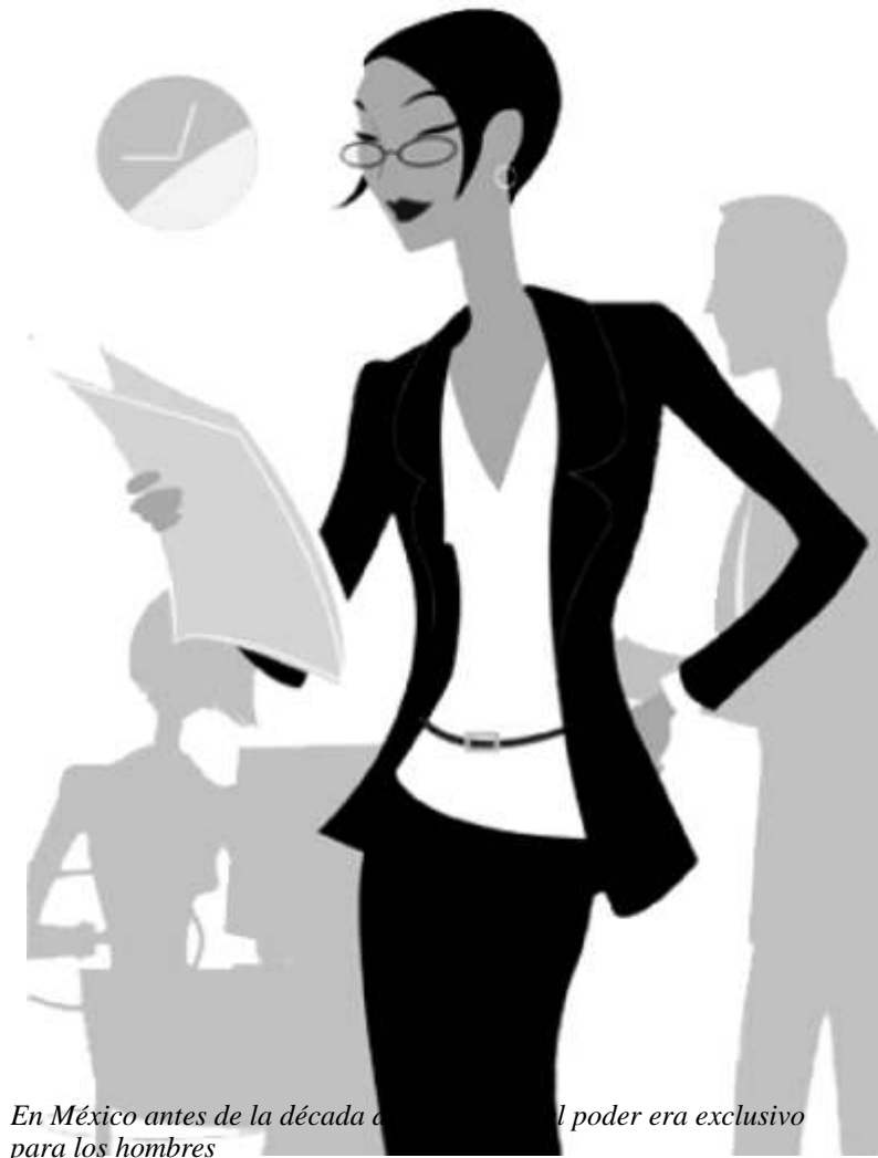
En México antes de la década de los ochenta el poder era exclusivo para los hombres

Cinco años después prosiguieron las perredistas Rosario Robles (Distrito Federal, Interinato, 1998-2000) y Amalia García recientemente electa (Zacatecas, 2004-2010).