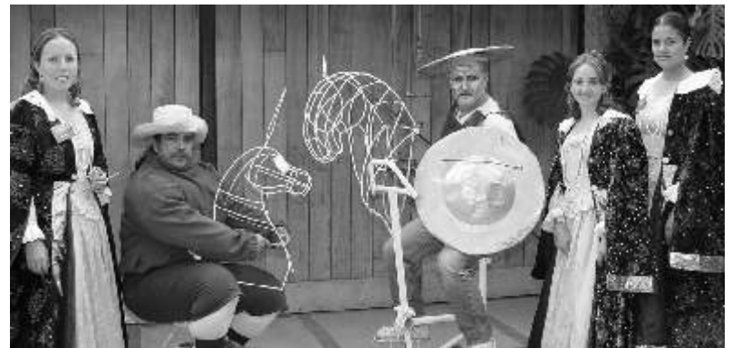
El Quijote y Sancho Panza fueron personificados durante la comida.

Como todas las semanas, les exhortamos a que formen parte de nuestras actividades culturales universitarias, la mayoría se imparten de forma gratuita o a muy bajo costo, hay que seguir apoyando este tipo de espacios, de los cuales podemos disponer en cualquier momento y aprovecharlos. Vale la pena gastar un poco para cultivar nuestra mente y espíritu, y, quien sabe, hasta podríamos descubrir alguna habilidad o gusto en particular para alguna o varias de las fantásticas expresiones que tienen el arte y la cultura de este y otros países o, más aun, que existen en nuestro estado.