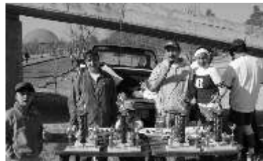
Promover el deporte y la convivencia fue el objetivo principal