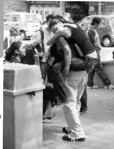
Cada quien agarra su burro