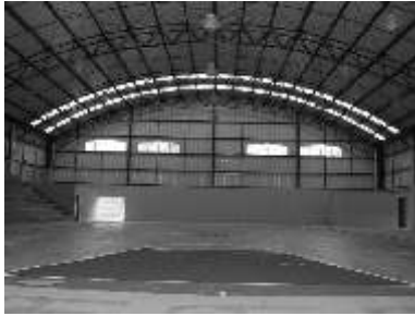
Con una capacidad aproximada de mil 200 espectadores