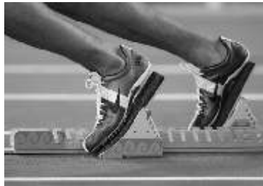
Se esperan medallas

Dentro del Regional CONDDE 2004, celebrado en la Universidad Bonaterra de Aguascalientes, fueron sólo cinco los alumnos que lograron competir, ahora la cifra aumentó a un