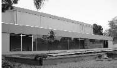
el recinto cuentan con señalización para tres tipos de canchas

Las águilas de la UPAEP logran una victoria más en la Conferencia Nacional de Baloncesto Varonil de la Comisión Nacional Deportiva de Instituciones Privadas (CONADEIP) derrotando a los visitantes de la Universidad Panamericana de la