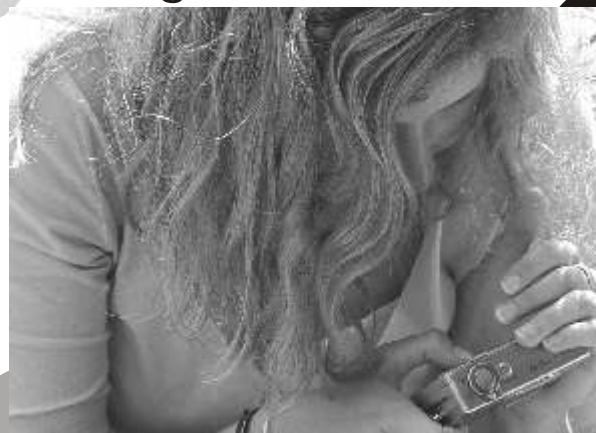
Esta foto salió rebien