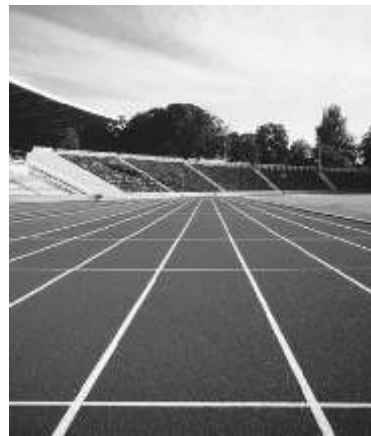
Ilustración: Leticia Ramírez

Cabe recordar que en el regional del año pasado se consiguieron cuatro medallas. una de oro y cuatro de plata; por lo tanto, son seis las medallas que se esperan en este 2005, logrando cuatrocientos sesenta y cinco puntos, quedando en el octavo lugar de la región número siete, donde quince instituciones participaron.