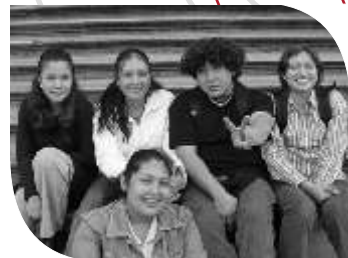
Grupo de 4° de Enfermería.