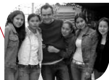
Grupo de Ciencias de la Comunicación.