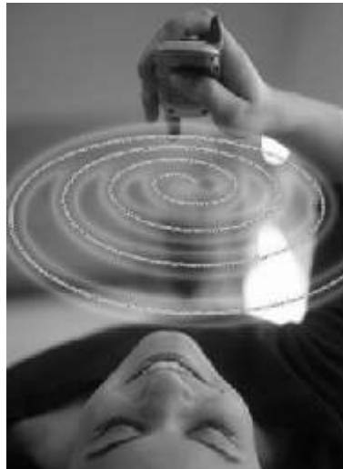
Mayor frecuencia mejor sonido.

El principal conflicto se fundamenta en un sistema de bandas que utilizan las redes inalámbricas y las ondas electromagnéticas. Esta banda recibe el