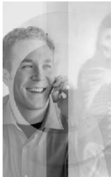
Los campos RF no pueden producir radioactividad

calor. Todos los efectos establecidos debido a la exposición a la RF están relacionados con el calentamiento. Por tal motivo las empresas de telefonía celular están tomando sus precauciones al respecto, por lo que una manera de contrarrestar la energía concentrada es dando menos potencia, es por eso que los celulares nuevos cuentan con una pila más chica y menos complicada para poder lograr que estas ondas no causen ningún tipo de daño. Además, en respuesta a la inquietud del público la Organización Mundial de la Salud (OMS) ha establecido el Proyecto Internacional de Campos Electromagnéticos para evaluar las evidencias científicas de los posibles efectos en la salud. El proyecto estableció un mecanismo formal para la revisión de los resultados de investigaciones y evaluación de los riesgos de exposición a RF. La OMS también está dirigiendo su propia investigación, consistente en un estudio epidemiológico a gran escala coordinado en más de 10 países por la Agencia Internacional de Investigación del Cáncer (IARC para identificar si existen enlaces entre el uso de teléfonos móviles y el cáncer de la cabeza y el cuello. A la fecha, ninguna investigación ha logrado establecer criterios definitivos sobre la relación entre el cáncer y los teléfonos celulares; sin embargo, desde hace décadas se tiene la creencia de que puede existir. Mientras tanto, las empresas telefónicas continuarán vendiendo productos que pueden ser causantes de la muerte.