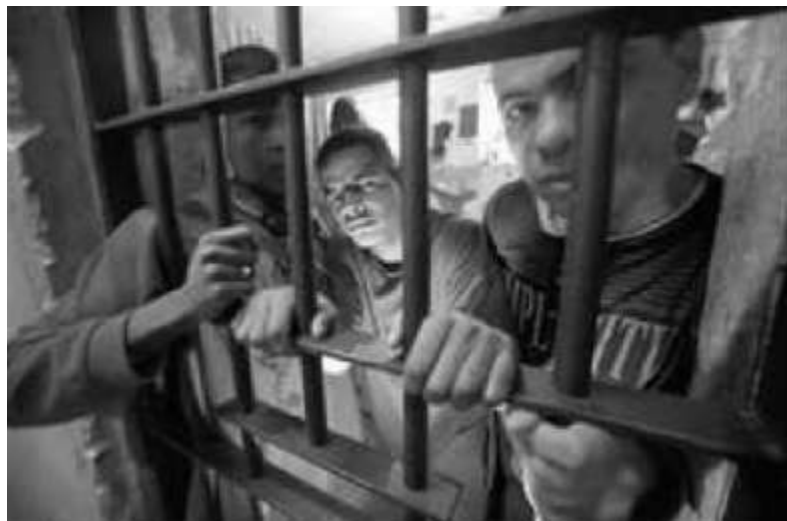
Disputa entre el narcotráfico y el Gobierno Federal

Debido a que al interior de las cárceles se han librado batallas de corte vengativo entre capos de la mafia, el actual