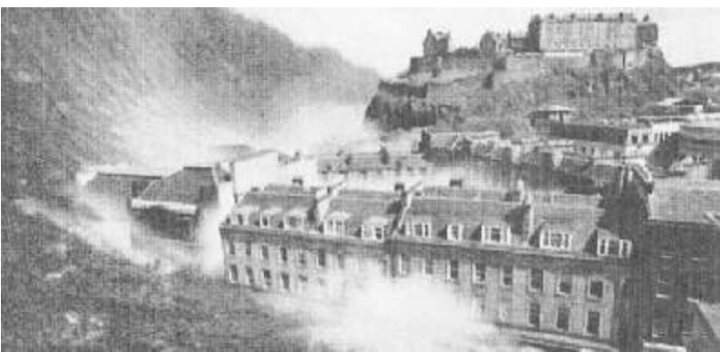
Adaptación del "Scotland on Sunday"

Cuenta la Biblia que David colocó una piedra en su honda, le dio vueltas y la lanzó contra el gigante Goliat; él cayó herido y trató de entender cómo alguien tan pequeño lo había vencido con un objeto tan simple como una piedra. Podría hablar sobre la historia de los gigantes; sin embargo, detallaré la relación existente entre los tsunamis y los meteoritos.