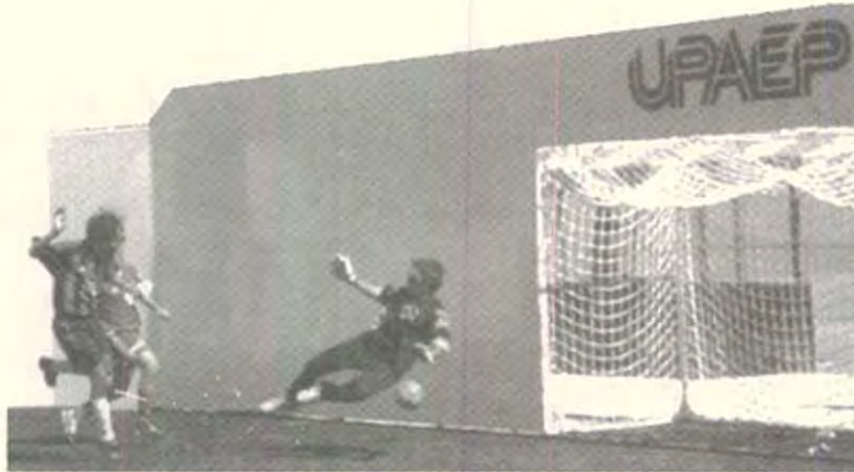
UPAEP anotando un gol a los futuros campeones

Las nuevas instalaciones deportivas anexas al campus central y en particular, la cancha nueva de pasto sintético fue inaugurada por las 16 instituciones que disputaron los primeros lugares. De la rama