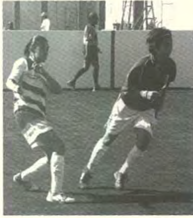
El fútbol rápido femenino perdió 3 a 1

¡Alerombo, Alerombo!, fue la respuesta de la porra que nunca dejó de apoyar a sus representantes; aunque minutos más tarde, en otro desconcierto de la misma guardameta, la número 14 de Monterrey metió el segundo tanto que dejaba abajo