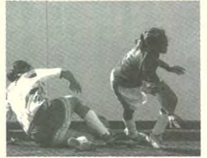
Las Águilas entraban con todo, peleaban cada balón

En el ambiente resonaba el ¡yo si le voy, le voy a las Águilas!, La presión era para las visitantes; pero una vez más en errores de la defensa y la portera locales florecieron. La número 14 de las regias no perdonó y de tiro cruzado batió las redes. Y así, en un viernes triste para el