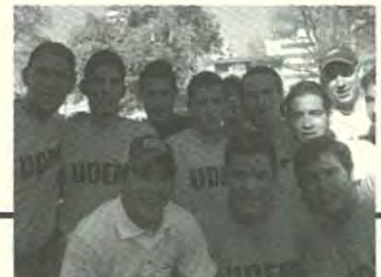
Equipo de la UDEM