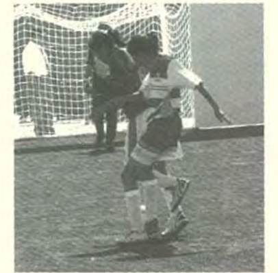
UPAEP dominaba el encuentro

fútbol rápido femenino se perdió 3 a 1. Aún así, la incansable porra Águila premió el esfuerzo y la entrega de sus jugadoras entonando juntos el ¡alerombo, alerombo!.