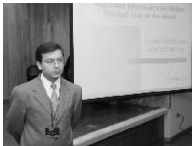
El grupo de capacitación DIKÉ enseñó a los alumnos

Mencionaron que esta es la sexta vez que imparten este tipo de conferencia y taller en donde se trataron temas como la asertividad, la primera imagen, actitudes, seguimiento y plan de vida laboral; obteniendo un buen resultado de interesados con el propósito de entrenar a las personas