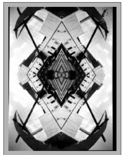
Estilo fotográfico de composición geométrica

Cabe destacar que la autora de esas obras fotográficas ha participado en cuatro exposiciones, dos individuales y dos compartidas con otros fotógrafos mexicanos.