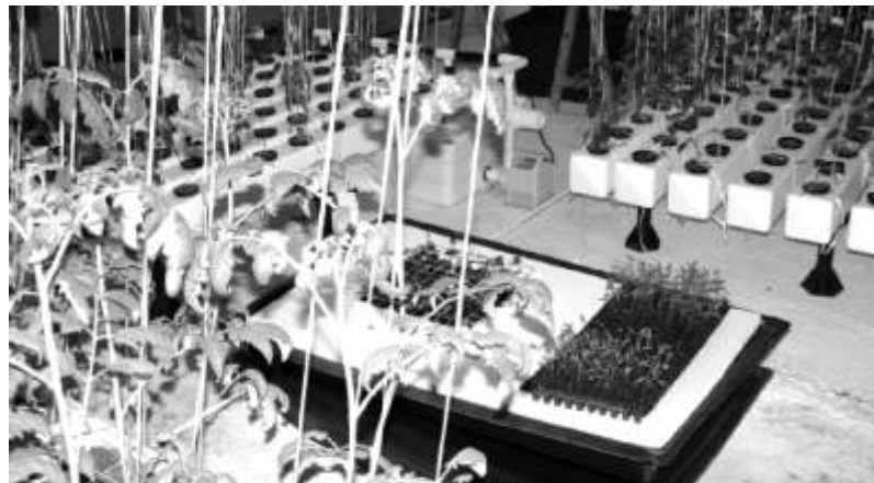
Plantas cultivadas con el proceso de hidrofonía en su proceso experimental

Este proyecto, el cual dio inicio hace mes y medio, contó con el apoyo de la Dirección de Investigación de esta casa de estudios; Peñaloza adelantó que se pretende ampliar este invernadero que por el momento se ubica en la parte alta de el Departamento Psicopedagógico a un lado del Centro Universitario de Cómputo (CUC), con la finalidad de continuar con las investigaciones, promover el uso de la hidrofonía y mejorar las condiciones de los cultivos.