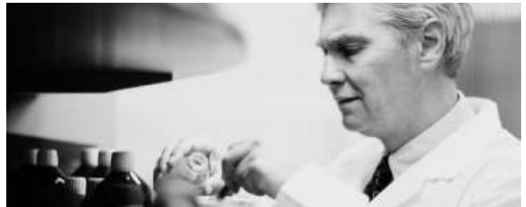
Este taller tiene como finalidad enseñar a interpretar correctamente los estudios de laboratorio

"Es importante que los alumnos aprendan a interpretar las pruebas de laboratorio, ya que no sólo son valores normales que muchas veces acompañan esas pruebas". El taller tendrá una duración de dos horas en las cuales se llevarán a cabo ejercicios prácticos donde los alumnos deberán interpretar si los estudios están anormales o si están dentro de los rangos conocidos como normales.