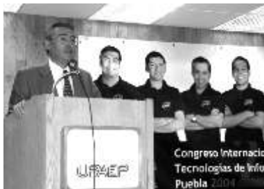
El rector inaugura el CITIP

El primero corresponde a la nueva versión de Windows, que además de incluir una barra con las herramientas más utilizadas, cuenta con la siguiente versión del messenger, que facilitará las relaciones sociales de los contactos y servirá también como una base de datos de las personas que están en línea. Ese