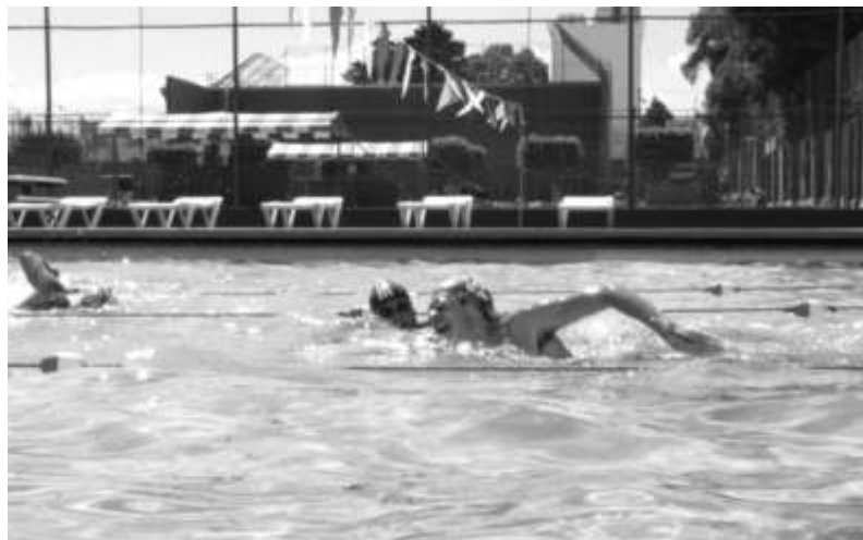
Natación se cuelga 34 medallas en el último mes durante las competencias

Por otra parte, Las Águilas Acuáticas también participaron en un torneo a nivel estatal denominado “ Torneo Orcas”, enfrentándose a 180 nadadores, donde obtuvieron el quinto lugar por equipos. A este torneo no asistieron todos los miembros del equipo, ya que están preparándose para el CONADEIP que se disputará del 16 al 20 de noviembre en las