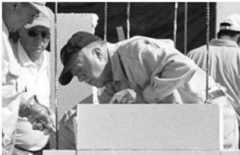
Alumnos de Arquitectura ayudaron a la construcción de casas en el PJC 2004

El proyecto Jimmy Carter (PJC) se inició gracias al compromiso del ex-presidente de los Estados Unidos y ganador del Premio Nóbel de la Paz, Jimmy Carter, al unirse a la misión de "Habitat para la Humanidad", que han reunido cada año a miles de voluntarios con el fin de construir casas para personas que viven en condiciones inadecuadas alrededor de todo el mundo, esta vez se llevó a cabo en las ciudades de Puebla y Veracruz. La participación como voluntario en este proyecto tuvo un costo de inscripción de 50 dólares, sin embargo, los alumnos de la UPAEP participaron sin costo alguno: "tuve la oportunidad de conseguir que becaran a 30 alumnos de noveno semestre de Arquitectura para que participaran en este proyecto que consiste en la construcción de 75 casas, las cuales deberán tener por unidad una extensión de 75 metros cuadrados de promedio. Se ubicarán en el sur de la