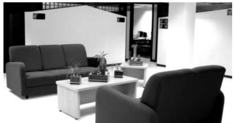
En las nuevas oficinas quedarán instaladas las áreas de Posgrados, Educación Continua y EATI