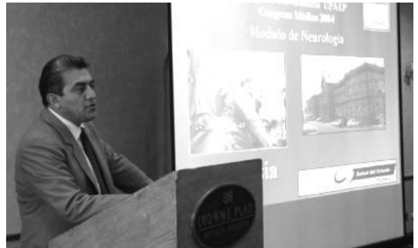
El Hospital Universitario UPAEP llevó a cabo el Primer Congreso Médico 2004.

Para concluir podemos decir que el Alzheimer constituye uno de los retos sanitarios y sociales más importantes de las próximas décadas, especialmente para los países con un alto porcentaje de la población de la tercera edad. La importancia del problema radica en la alta manifestación entre la población anciana, su carácter crónico y los problemas sociales derivados. Sin lugar a dudas este mal es un verdadero reto, no sólo para la ciencia, sino también para las autoridades responsables del bienestar sanitario y social.