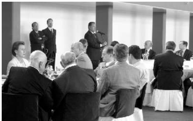
El Lic. Melquiades Morales, destacó el papel que ha jugado la Universidad en Puebla

En su intervención, el Lic. Melquiades Morales Flores, Gobernador Constitucional del Estado de Puebla, subrayó “es un honor recibir esta distinción por parte de la UPAEP”, agregó-estoy convencido de que la educación es la palanca “maravillosa” para el desarrollo de cualquier pueblo, “en la medida en que nosotros eduquemos a nuestra gente, a nuestro pueblo, les demos diferentes oportunidades y abramos los caminos para ellos, Puebla será una gran ciudad, más de lo que ya es, en donde los niños y jóvenes del futuro, tengan certeza de que van a vivir mejor y de que van a tener mejores niveles de bienestar, al final de cuentas es el objetivo de todo gobierno”.