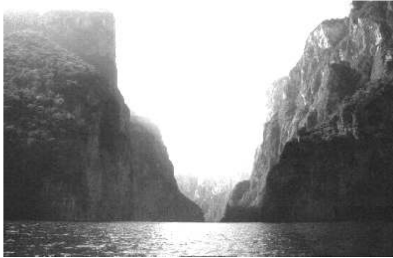
Cañón del sumidero en Tuxtla Gutierrez

En Chiapa de Corzo, el calor cae como plomo, no hay nube que se cruce entre los rayos y el suelo, así que me compré un trago de pozol bien frío, bebida de masa de maíz con cacao. En este municipio conocí una fuente única en el mundo, tiene una base octagonal que mezcla el estilo gótico con el renacentista italiano, su construcción semeja la figura de una corona. Este lugar fue la primer villa del Estado de Chiapas fundada por los españoles Luis Marín y Diego de Mazariegos.