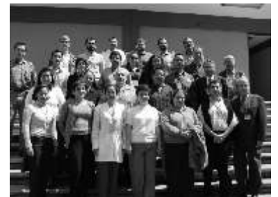
Los 30 asistentes en la UPAEP

En el encuentro se expusieron experiencias tanto académicas, como de diferencias de programas de acuerdo a las universidades, metodología de impartición de los tópicos y también trataron el perfil del maestro. Al encuentro asistieron 30 maestros que visitaron Puebla de universidades provenientes de Monterrey, Veracruz, Cuernavaca, DF, Guanajuato, Guadalajara, San Luis Potosí, entre otras.