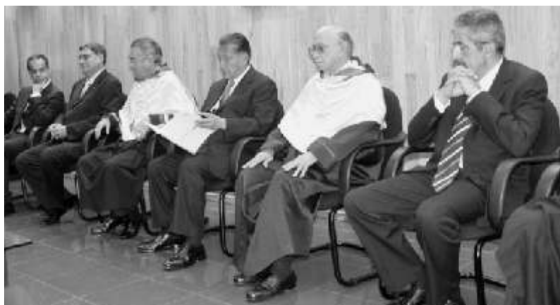
Autoridades académicas, gubernamentales y municipales presentes en el informe