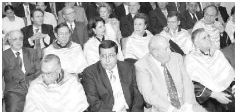
Personalidades de los diferentes sectores asistieron al informe

Asimismo, dijo que otras acciones a favor de certificar la calidad académica de la institución, se extendieron a programas específicos como la Facultad de Medicina, acreditada también desde 1996, logró su refrendo ante el Consejo Mexicano para la Acreditación Médica (COMAEN); se sumaron las certificaciones de la Facultad de Arquitectura, otorgada por el Consejo Mexicano para la Acreditación de la Enseñanza de la Arquitectura (COMAEA); las carreras de Administración de Empresas y de Contaduría, por el Consejo de Acreditación de la Enseñanza en Contaduría y Administración (CACECA); la carrera de Ingeniería Industrial entregó su evaluación al Consejo de Acreditación de la Enseñanza de la Ingeniería (CACEI) y se está a la espera del dictamen; varios