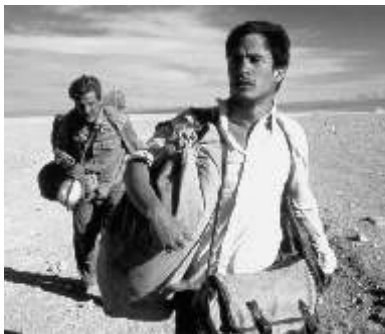
Es una película sobre la camaradería

Este filme no es la narración sobre el héroe radical revolucionario, ni tampoco es una pesada lección de historia sobre cómo se convirtió símbolo ideológico.