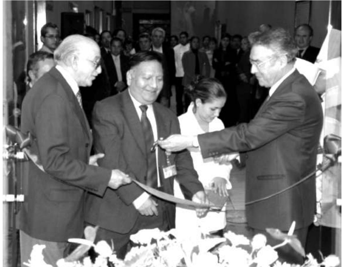
La autoridad de esta casa de estudios al cortar el listón inaugural.

Un nuevo laboratorio de alimentos para estudiantes de Gastronomía y Administración de Instituciones, aulas educativas, salones para Educación Continua e Innovación Educativa, distribuidos en un área de 1556 metros cuadrados son otras inversiones que se suman a la restauración de este antiguo edificio.