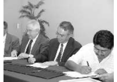
Especto de la firma oficial

participación sea realmente un auténtico Servicio Social, en la que se le permita al estudiante conocer las necesidades de sus conciudadanos y comprometerse a ayudarlos”, mencionó