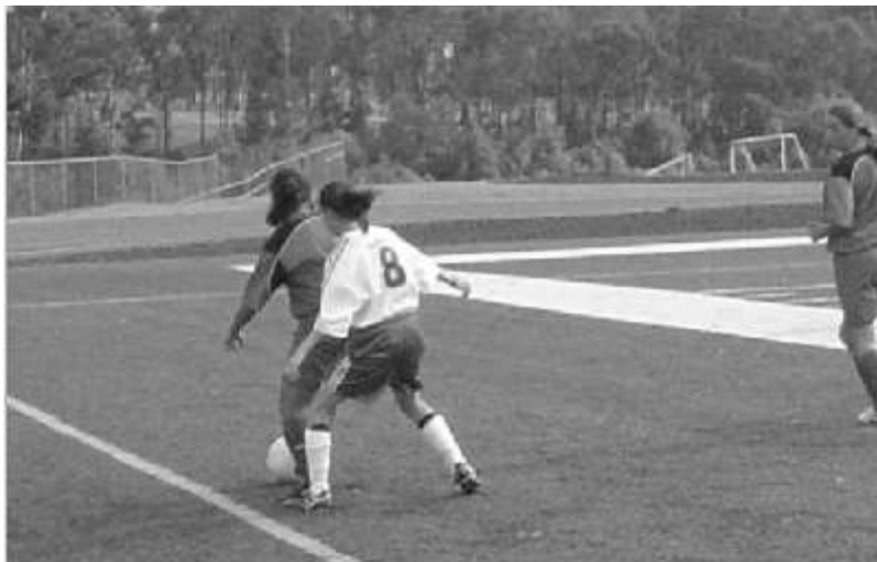
En imagen de archivo. Las Águilas contra el TEC

Había transcurrido menos de un minuto, cuando las visitantes se apoderaron del balón y en un contundente tiro metieron el segundo gol a su favor. Luego el tercer gol lo anotó la número 7 de las azteca que demostró sus habilidades técnicas, tomó