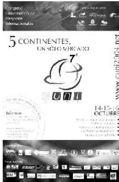
Imagen del cartel promocional