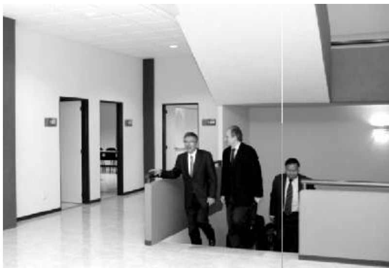
Así luce el renovado edificio. La fotografía muestra a las autoridades universitarias recorriéndolo

Otra de las nuevas inversiones que ha hecho la Universidad en esta área de Tecnología Educativa es el Laboratorio de Alimentos, el cual tiene una