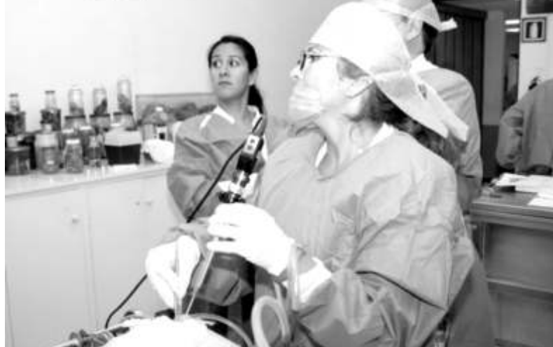
Durante el taller, los otorrinolaringólogos realizaron cirugías en 10 cabezas humanas