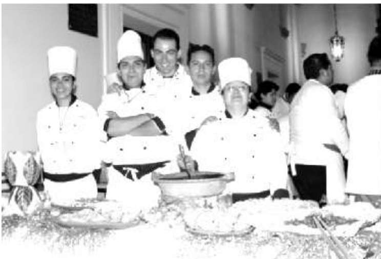
Alumnos de la UPAEP participaron con platillos hechos con carne de conejo