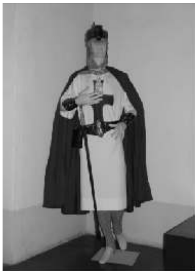
La exhibición se clausurará el 24 de septiembre

La finalidad del Museo UPAEP es dar a conocer toda la fe y tradición que esta población española manifiesta a Santiago. La exposición resulta ser una parte de los actos en homenaje a este