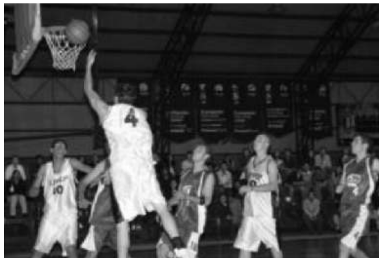
UPAEP vence en el clásico contra la UDLA

En un juego dinámico que no se detenía para nada, los Aztecas encestaban presionando con algunas faltas, mientras que al despertar de la porra águila los de Ceniceros tejían las jugadas que los llevarían al triunfo; porque según dicen, "se puede perder