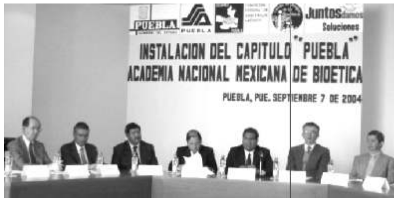
La UPAEP forma parte del Capítulo Puebla de la Academia Nacional Mexicana de Bioética