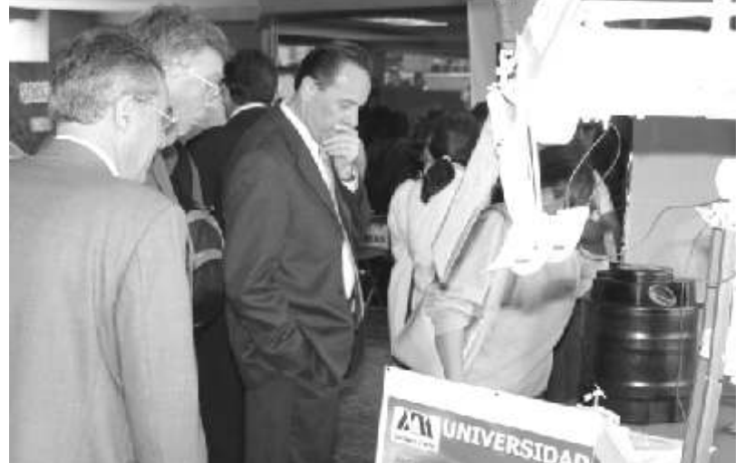
Las autoridades de la UPAEP observando proyectos de la Expo Ciencia 2004

De acuerdo a la selección de proyectos, se les otorgará a las mejores investigaciones la oportunidad de asistir a cinco actos internacionales según su categoría. Uno será en Chile, en el marco de la Expo-Ciencia Internacional; el de Ciencia y Tecnología, en Brasil; el mejor proyecto al Foro Internacional de Ciencia Juvenil, en Londres, Inglaterra; el mejor