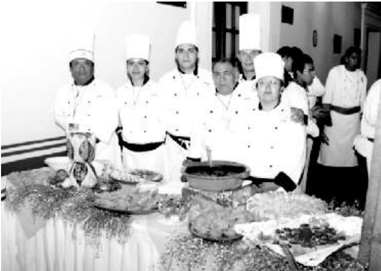
Miembros de la Escuela de Gastronomía asesorando la exposición culinaria

Tras haber participado en el Octavo Congreso Internacional de Cunicultura, la Escuela de Gastronomía de la UPAEP donó a la biblioteca del Ayuntamiento de Puebla un recetario membretado con el escudo de esta Institución, que incluye varios guisos hechos a base de carne de conejo.