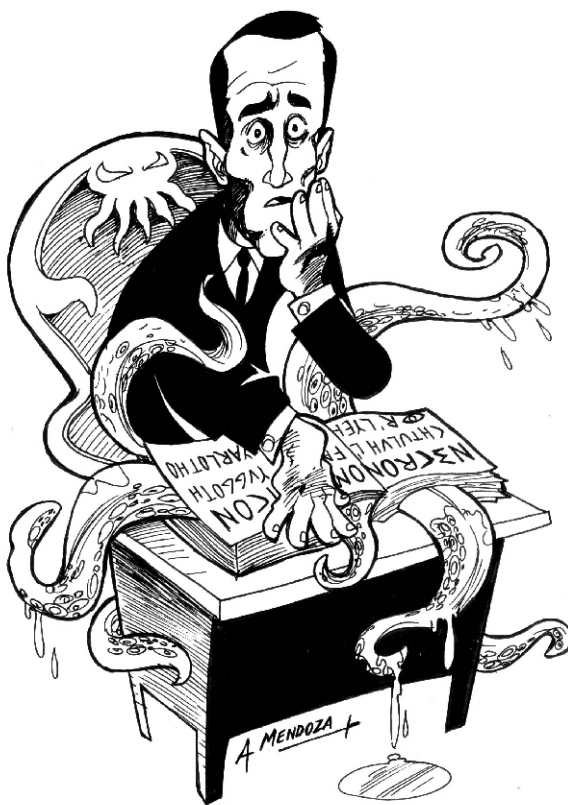
HOWARD PHILLIPS LOVECRAFT

En la mayoría de la obra de Lovecraft, se encuentra una continuidad. Así, la mitad de los acontecimientos suceden en el pueblo de Arkham y su universidad, referencias constantes a Dunwich y Las Montañas de la Locura, personajes que aparecen en varios relatos, como Randolph Carter, el Dr. Armitage, Herbert West, etc. y