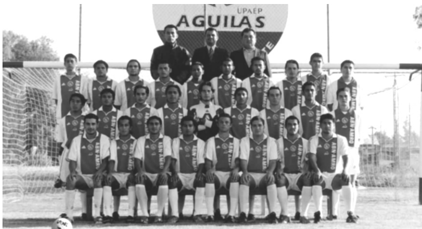
LAS ÁGUILAS LISTAS PARA LEVANTAR EL VUELO