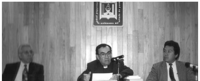
MONSEÑOR ROSENDO HUESCA PACHECO, ARZOBISPO DE PUEBLA INVITÓ A LOS UNIVERSITARIOS A PROMOVER LOS PRINCIPIOS Y VALORES