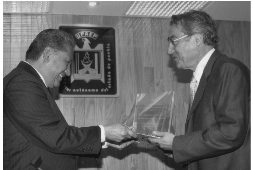
EL GOBERNADOR DEL ESTADO DE PUEBLA, LIC. MELQUIADES MORALES FLORES HABLÓ DE LA IMPORTANCIA DE LA EDUCACIÓN EN EL CRECIMIENTO DE LA ENTIDAD