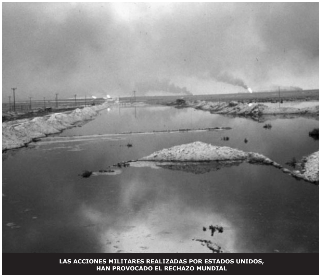
LAS ACCIONES MILITARES REALIZADAS POR ESTADOS UNIDOS, HAN PROVOCADO EL RECHAZO MUNDIAL

La invasión iraquí en Kuwait seguía en curso, los días y las noches se fueron haciendo semanas y meses, y la desesperanza y la angustia se hicieron presentes en el ánimo de los kuwaitíes al ver saqueado su país. Al mirar por la ventana de las casas podían verse tanques y regimientos de soldados iraquíes por las calles.