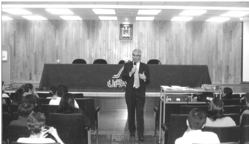
NO CONFUNDIR EL ÉXITO CON LA SATISFACCIÓN DE NECESIDADES MATERIALES

Pero para que el individuo pueda encontrar este camino al amor de