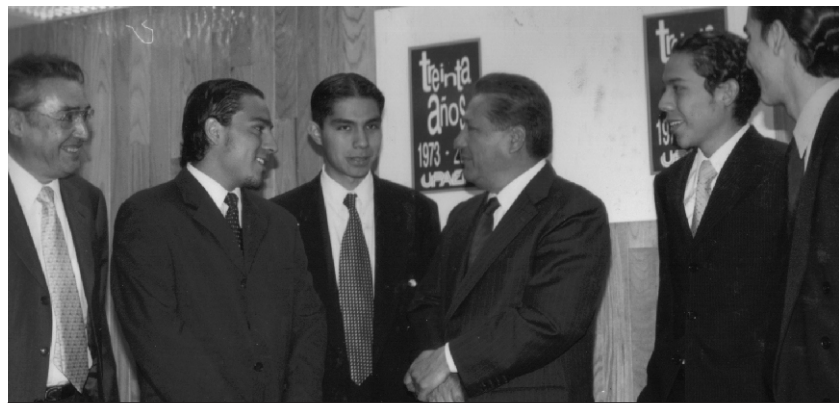
EL GOBERNADOR MELQUIADES MORALES, CONVERSÓ CON LOS ALUMNOS DESTACANDO EL PAPEL DE PUEBLA EN EL DESARROLLO ECONÓMICO

El desarrollo económico, la solución para combatir la pobreza