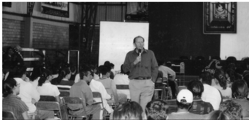
EL UNIVERSITARIO PROTAGONISTA DEL CAMBIO

Con esta comparación el ponente ayudó a los asistentes a entender que para ser un líder es necesario tener espíritu de iniciativa, tener claros los objetivos, y en base a ellos, desarrollar estrategias que lleven a