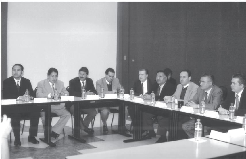
EL PRESENTE CONVENIO PERMITIRÁ A LA UNIVERSIDAD OPTIMIZAR LOS SERVICIOS QUE PRESTA A TRAVÉS DE LA RED

Cabe destacar que Avaya cuenta con clientes de todo el mundo, abarcando América del Norte y del Sur, el Caribe, Europa Occidental y Oriental, además de la región de Asia y el Pacífico; destacándose organizaciones como: Siebel, Atento, Bank One, Amazon.com, Lufthansa, Prudential, Uniglobe.com, KPMG, GE, Intel, Telecom Italia, Morgan Stanley Dean Witter, AXA, Hilton, CITI, IBM, Telefónica, Samsung, Compaq, Cable & Wireless, Paine Webber, Lloyds TSB, McGraw-Hill, Qantas, JetBlue, WalMart, Deutsche Bank, Nextstar, Lucent,