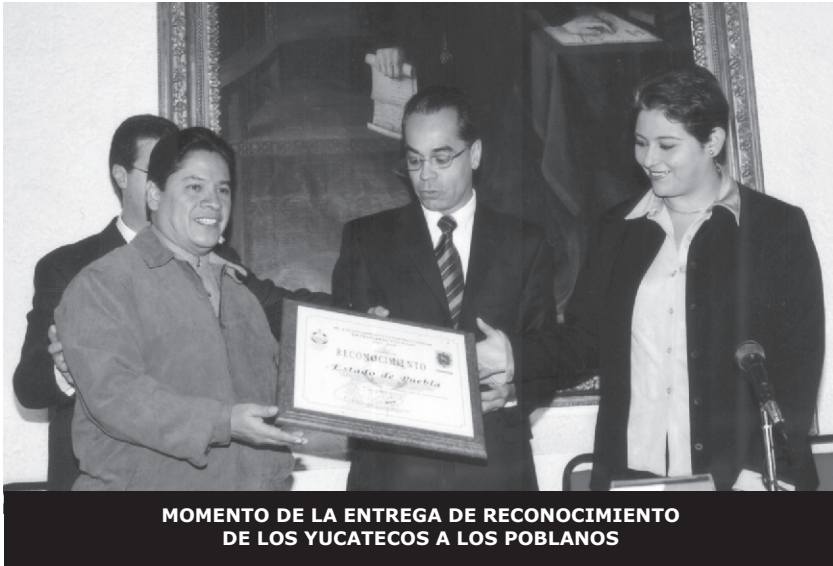
MOMENTO DE LA ENTREGA DE RECONOCIMIENTO DE LOS YUCATECOS A LOS POBLANOS

Como muestra de agradecimiento por haber colaborado en el proceso de ayuda para los damnificados del huracán Isidoro, el Grupo Interuniversitario de Participación Social (GIPS), integrado por la UPAEP, BUAP, UMAD, UIA y el Colegio Americano de esta ciudad, se reunieron en el Congreso del Estado, para efectuar la entrega de un reconocimiento a todos los poblanos de parte de las autoridades de Puerto Progreso, Yucatán.