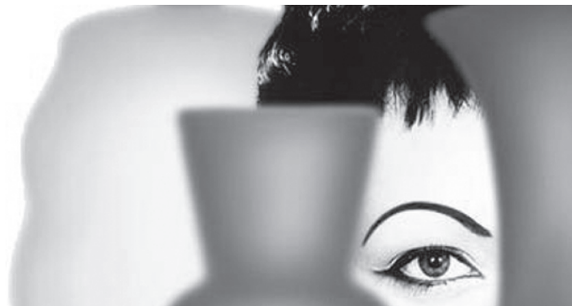
¿LA BELLEZA VALE O CUESTA?