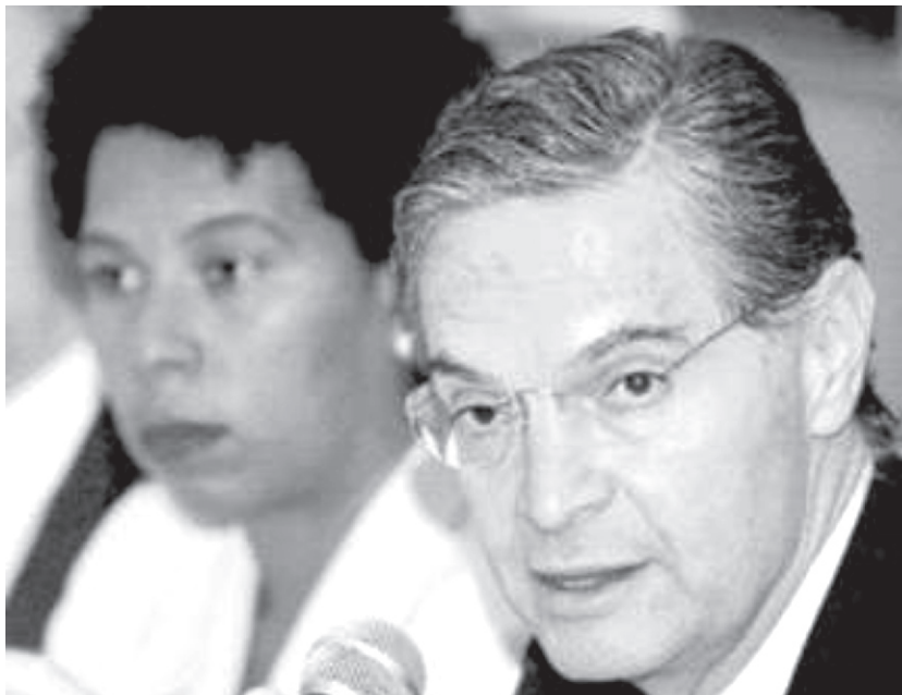
LA ESCENA POLÍTICA DE LOS PRIVILEGIADOS

Finalmente cabe mencionar que ha sido esta mujer de indudable inteligencia (y quien ha convertido la oficina y la residencia oficial en un verdadero santuario, siendo el más favorecido San Charbel el monje libanés) quien ha puesto a la cabeza del poder entre la espada y la pared, ya que no es secreto para nadie que ella y la hija mayor del Presidente