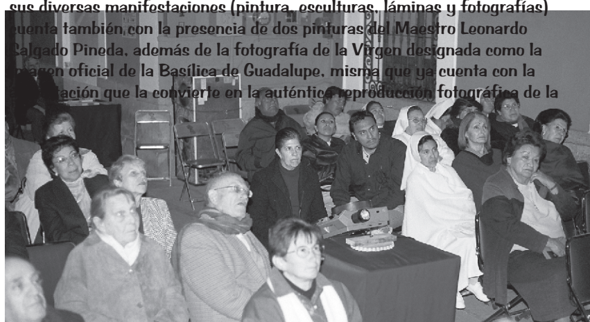
EL INTERÉS DEL PÚBLICO SE DEJÓ VER EN LA CONCURRIDA ASISTENCIA