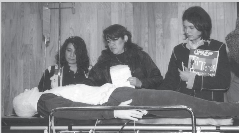
LOS ALUMNOS PONDRÁN EN PRÁCTICA SUS CONOCIMIENTOS CON LOS NUEVOS SIMULADORES

* El equipo de simulación está respaldado con el modelo de trabajo de la Universidad de Harvard.