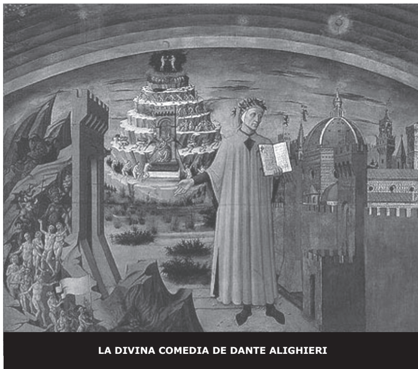
LA DIVINA COMEDIA DE DANTE ALIGHIERI

comisiona a Virgilio para rescatar a Dante y ser su guía y protector durante el recorrido infernal; una protección muy necesaria, ya que los dos poetas son amenazados en varias ocasiones por los demonios moradores del infierno: Minos, el juez maligno, quien para sentenciar a un condenado se enrolla en el cuerpo su cola tantas veces como sea el número del círculo al que debe ser enviado; los centauros, guardianes del foso de sangre del séptimo círculo, donde están los tiranos; las almas de la ciudad de Dite, quienes les niegan el acceso, y los demonios del Malebolge, el octavo círculo, quienes incluso les persiguen.