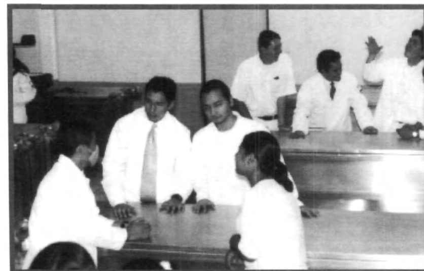
LOS LABORATORIOS DEL ÁREA DE MEDICINA FORMAN PARTE IMPORTANTE DE LOS RECURSOS DE ESTA FACULTAD