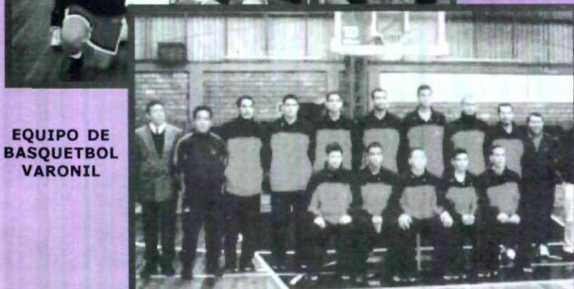
EQUIPO DE BASQUETBOL VARONIL