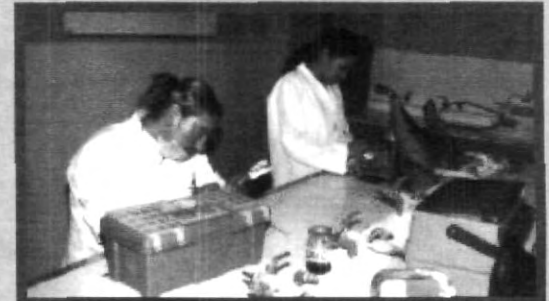
MEJORANDO LAS CONDICIONES DE LOS LABORATORIOS PARA INCREMENTAR CALIDAD EN LOS ESTUDIANTES