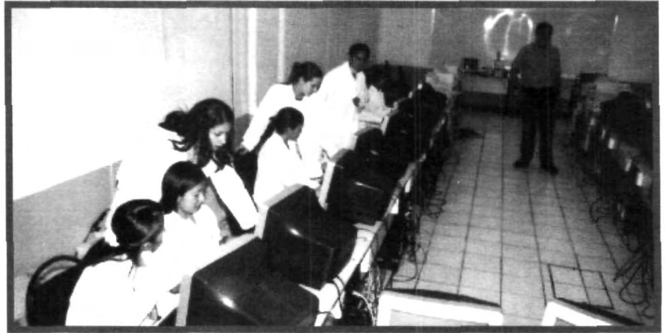
PARA UN BUEN APRENDIZAJE LO NECESARIO ES QUE CADA ALUMNO CUENTE CON EQUIPO PARA REALIZAR PRÁCTICAS