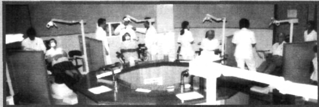
PORQUE UNA FACULTAD MERECE LO MEJOR LA UPAEP BRINDA LAS MEJORES INSTALACIONES