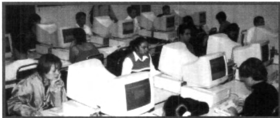
NO HAY PRETEXTO PARA NO HACER LA TAREA

Se amplió al doble, la planta física y servicios del Centro Universitario de Cómputo con una extensión adicional de mil metros cuadrados y una inversión de 8 y medio millones de pesos, comprende 550 equipos de cómputo, 530 Pc, 20 Imacs, 15 salas de clases, 5 cañones de proyección; 2 módulos de impresión a color y blanco y negro, un área de digitalización de imágenes, un laboratorio de hardware y redes con 20 Pcs, una sala general en la parte baja del edificio con 190 computadoras personales, mezanine y áreas con acceso inalámbrico a la red, laboratorio de redes y hardware. 15 salones de clase totalmente equipados con una computadora para cada alumno. Además se cuenta con software autorizado legalmente y personal altamente capacitado para la atención personalizada de los estudiantes.