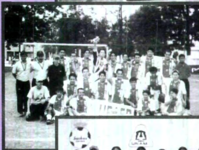
EQUIPO DE FUTBOL SOCCER