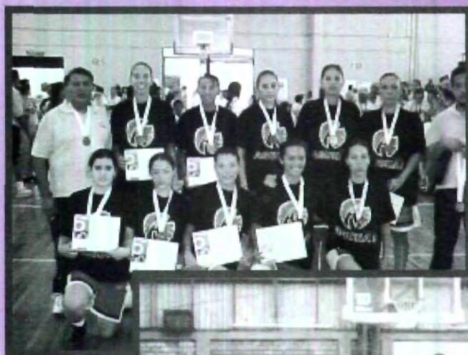
EQUIPO DE BASQUETBOL FEMENIL