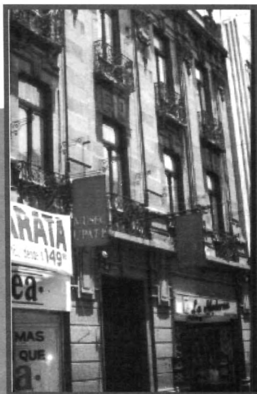
MUSEO UPAP, EL HOGAR DE LA CULTURA