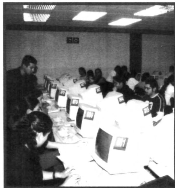
EL NÚMERO DE ALUMNOS AUMENTA, PERO LA UNIVERSIDAD SE MANTIENE A LA VANGUARDIA EN TECNOLOGÍA