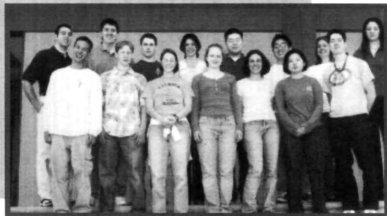
LA CONVIVENCIA CON ALUMNOS DE INTERCAMBIO ES UN APOYO MÁS PARA EL APRENDIZAJE DE OTRO IDIOMA

Con 2 mil 300 metros cuadrados de superficie, se reubicó el Centro de Idiomas UPAEP, con 21 salones especialmente habilitados para la enseñanza de idiomas, acreditado por el Gobierno Alemán para aplicar el examen internacional de dicha lengua denominado Test Daf, acreditación que ha sido otorgada a sólo 15 universidades en el mundo; el primer piso se habilitó con cubículos para profesores y salas de juntas, todo ello redundará en una mejor tutoría al alumno. El tercer piso se dedicará a institutos de investigación, de las diferentes disciplinas profesionales.