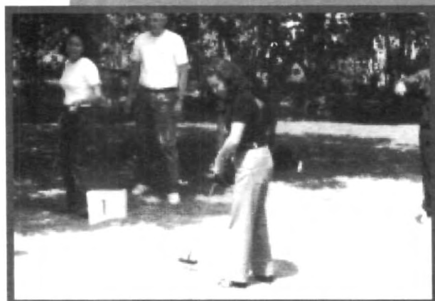
APROVECHANDO EL ÁREA VERDE