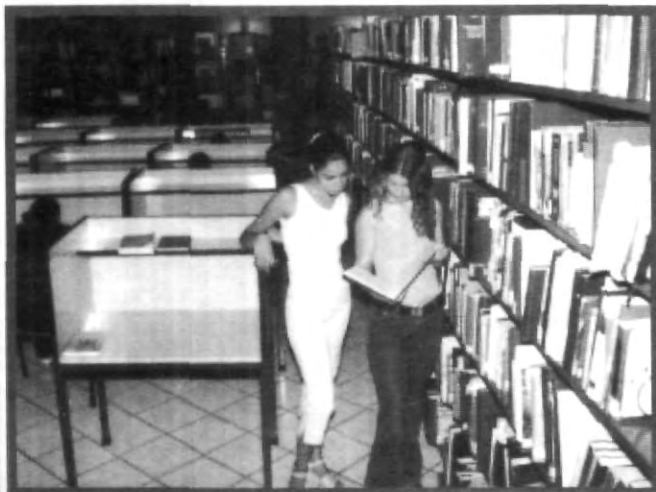
ACERVO BIBLIOGRÁFICO AL ALCANCE DE LOS ALUMNOS