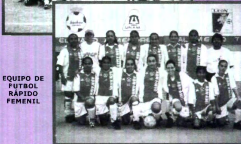
EQUIPO DE FUTBOL RÁPIDO FEMENIL