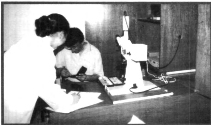
LA INVESTIGACIÓN ES OTRO FACTOR FUNDAMENTAL DENTRO DE LOS LOGROS DE LA UNIVERSIDAD