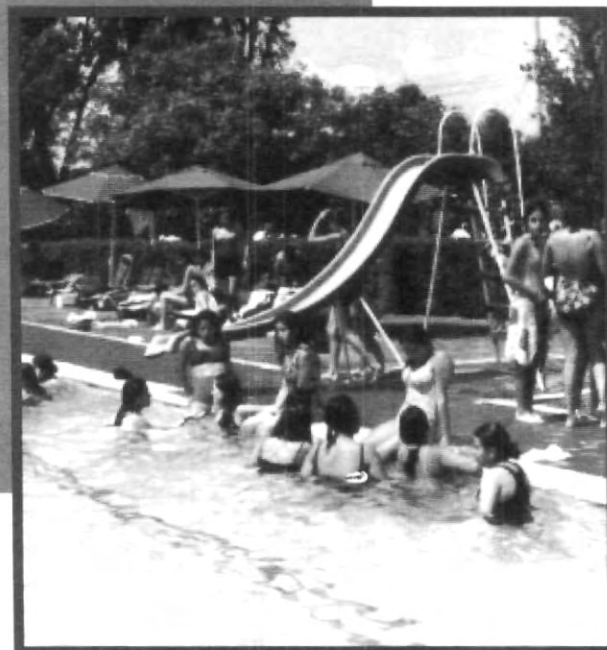
UNIVERSIDAD PENDIENTE DE LOS GUSTOS DE LOS ESTUDIANTES Y ESFORZÁNDOSE POR CRECER Y CUMPLIENDO SUS METAS