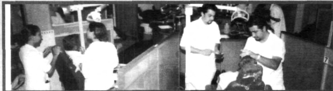
POCO A POCO LOS OBJETIVOS SE CONSIGUEN Y SE REFLEJAN EN MATERIALES Y NUEVOS EQUIPOS PARA EL APRENDIZAJE