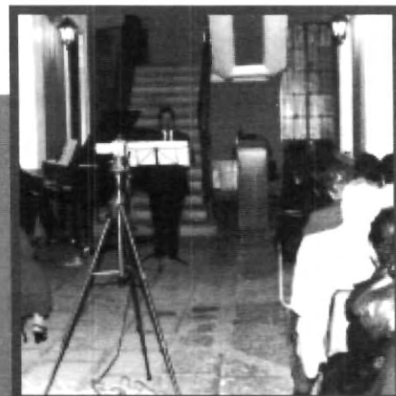
TALENTO Y BUEN GUSTO SIEMPRE HAN SIDO ELEMENTOS CLAVE PARA HACER DE LA UNIVERSIDAD, UNA INSTITUCIÓN RICA EN TODAS LAS ÁREAS