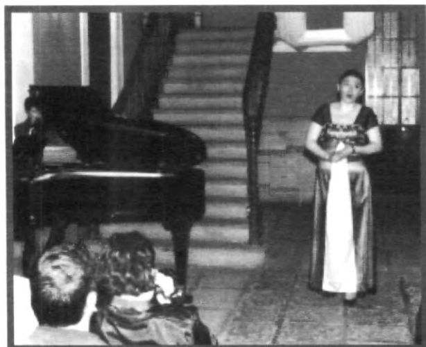
LA CULTURA REFLEJADA EN EVENTOS REALIZADOS EN EL MUSEO UPAP