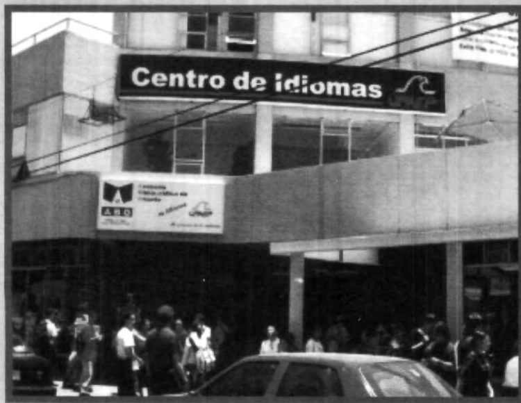
COMO UNA HERRAMIENTA MÁS A DISPOSICIÓN DE LOS ALUMNOS DE LA UPAEP, SE ENCUENTRA EL CENTRO DE IDIOMAS

Con 2 mil 300 metros cuadrados de superficie, se reubicó el Centro de Idiomas UPAEP, con 21 salones especialmente habilitados para la enseñanza de idiomas, acreditado por el Gobierno Alemán para aplicar el examen internacional de dicha lengua denominado Test Daf, acreditación que ha sido otorgada a sólo 15 universidades en el mundo; el primer piso se habilitó con cubículos para profesores y salas de juntas, todo ello redundará en una mejor tutoría al alumno. El tercer piso se dedicará a institutos de investigación, de las diferentes disciplinas profesionales.