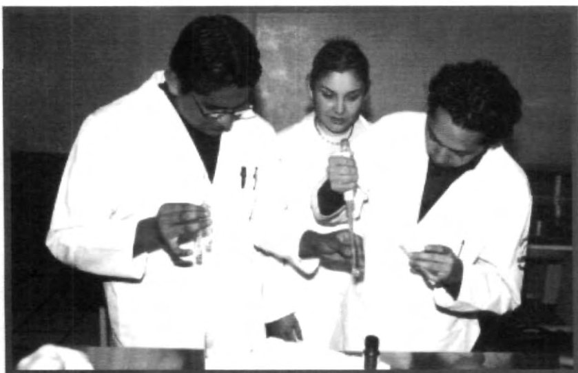
EN LA UPAEP, EL INTERÉS POR LA CIENCIA NO SE CREA, NI SE DESTRUYE, SIMPLEMENTE EVOLUCIONA