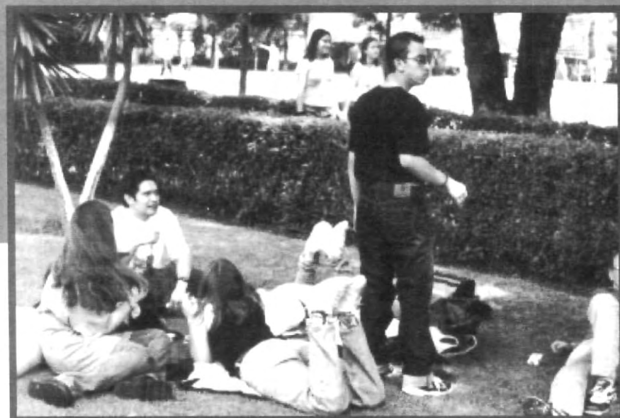
MÁS INSTALACIONES, MÁS DIVERSIDAD DE ACTIVIDADES DE RECREO