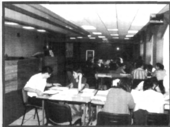
PORQUE LA UNIVERSIDAD RECONOCE QUE NO CUALQUIER LUGAR ES ADECUADO PARA ESTUDIAR