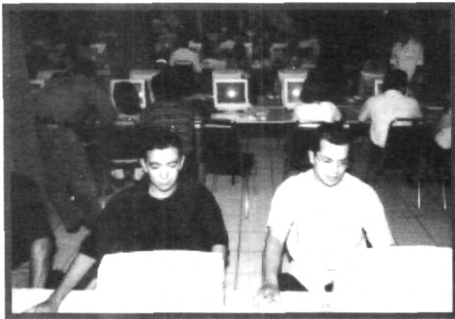
LA TECNOLOGÍA EVOLUCIONA Y LA UPAEP SIGUE SU PASO

En donde se realiza la aplicación y utilización de las herramientas que ofrece el internet para el apoyo educativo de manera virtual y rápida al estudiante.