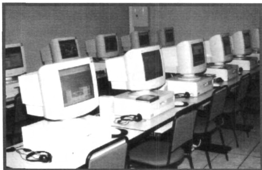
LA RENOVACIÓN DEL EQUIPO ES VITAL PARA CONTINUAR CON EL DESARROLLO

Como complemento a la función de guía que el maestro debe observar, la UPAEP cuenta con 3 mil metros cuadrados para laboratorios disciplinares e interdisciplinares, destinados a la carrera de medicina entre los que destacan dos salas de disección con lo cual se duplica la capacidad anterior, laboratorios de microbiología, ciencias funcionales, informática médica, morfología,