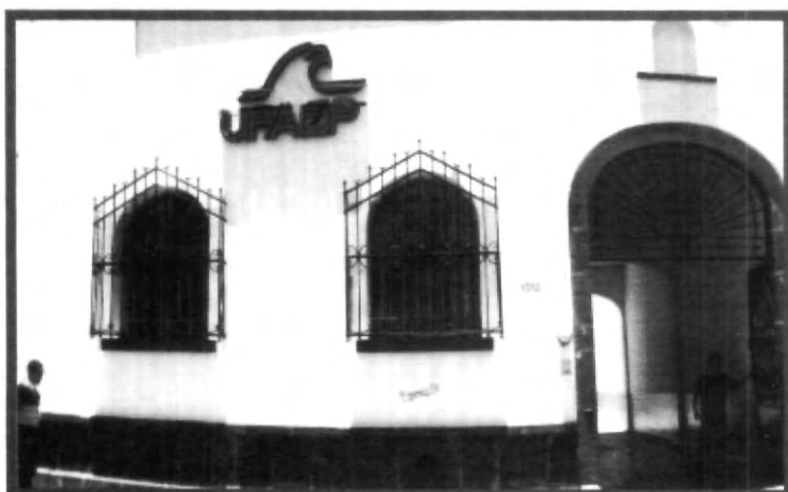
LA PROMOCIÓN DE LA CULTURA JUEGA UN PAPEL IMPORTANTE EN LA UPAEP

Economía refrendaron el primer lugar nacional, en el capítulo de educación superior, y por la calidad de la carrera de comercio internacional, recibiendo el galardón de manos del propio Presidente de la Republica.