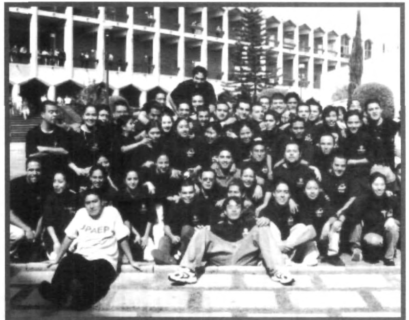
LOS ALUMNOS SON EL PILAR ESENCIAL PARA EL PROGRESO DE LA UNIVERSIDAD

En lo referente a los catedráticos de la UPAEP, maestros y directivos de la escuela de Comercio Internacional obtuvieron el premio de calidad, otorgado por el Consejo Mexicano de Comercio Exterior de la región y posteriormente, en el certamen nacional organizado por la Secretaría de