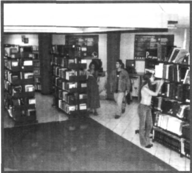
LOS ALUMNOS DISPONEN DE LOS RECURSOS NECESARIOS PARA SU DESEMPEÑO ACADÉMICO