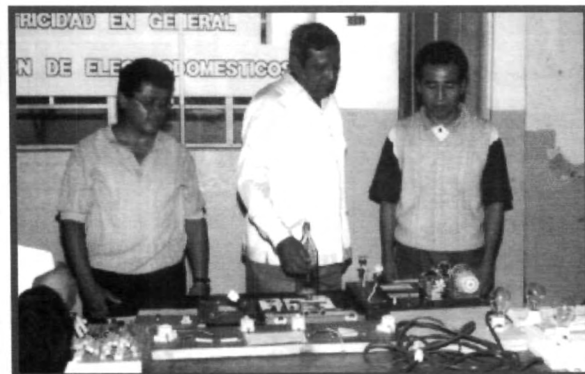
LOS DIFERENTES LABORATORIOS PERMITEN A LOS ALUMNOS REALIZAR SUS PRÁCTICAS

biología molecular y bioquímica, y área de cubículos para los maestros; próximamente se construirán dos laboratorios de química, termodinámica, electrónica, mediciones y mecánica, electromagnetismo, biología, hidráulica y geotecnia, para apoyar a las ingenierías que se imparten en la institución.