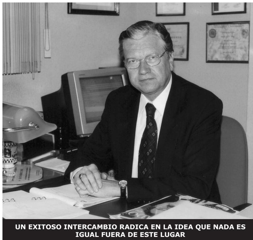
UN EXITOSO INTERCAMBIO RADICA EN LA IDEA QUE NADA ES IGUAL FUERA DE ESTE LUGAR

El panorama en otras universidades fue presentado, no sólo de Alemania