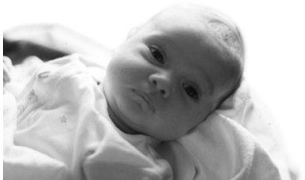
EL SOL BRILLA EN LA MIRADA DE CADA BEBÉ

Todos son unos bebés excepcionales, pero este bebé