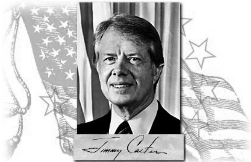
INCONFORMIDAD EN LA ENTREGA DE PREMIOS NOBEL

Con esto queda de manifiesto que la política norteamericana actualmente se debate entre una lucha por la democracia y una lucha de intereses, no en vano fue el nuevo atentado en Bali que dejó mas de 180 muertos y que recuerda a EEUU una vez más que no son un país intocable, el gobierno norteamericano debe entender que el diálogo será en estos días la única