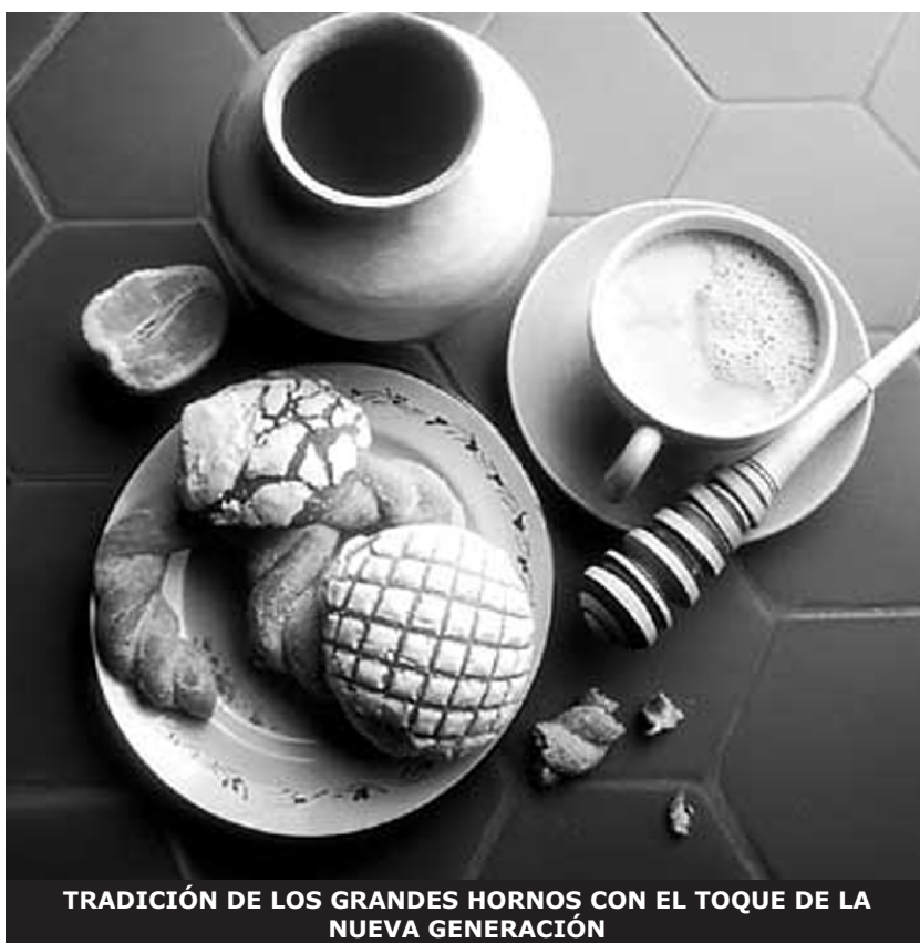
TRADICIÓN DE LOS GRANDES HORNOS CON EL TOQUE DE LA NUEVA GENERACIÓN

La participación de los alumnos de Administración de instituciones en el evento, así como la colaboración de las personas dedicadas al negocio panadero en