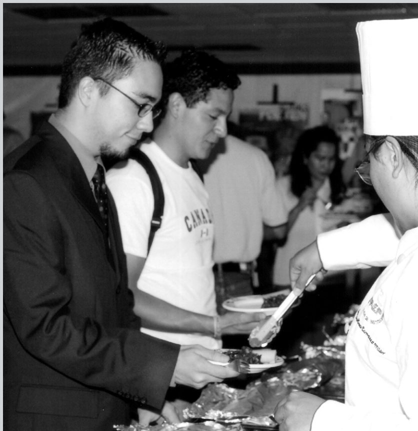
LA CULTURA ES EL PRINCIPAL VÍNCULO ENTRE NACIONES

Una de las festividades alemanas más conocidas en el mundo, es el Oktober Fest. En el que la gente se reúne para convivir bailando y bebiendo hasta que el cuerpo lo soporte. La cantidad de cerveza que se bebe podría impresionar a algunos extranjeros, pero el hecho de festejar octubre no se limita a beber cerveza sino a un desfile y muestra de folklore en el que participan grupos de todo el mundo y desfilan por Munich.