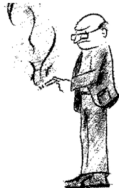
TABAQUISMO PASIVO, RIESGO IMPORTANTE PARA LA SALUD

Colabore para que no se permita fumar en las oficinas, salones, sanitarios, biblioteca ya que es una área de uso público. Usted es importante en la labor de mostrar a los demás que el humo del tabaco afecta a los fumadores involuntarios.