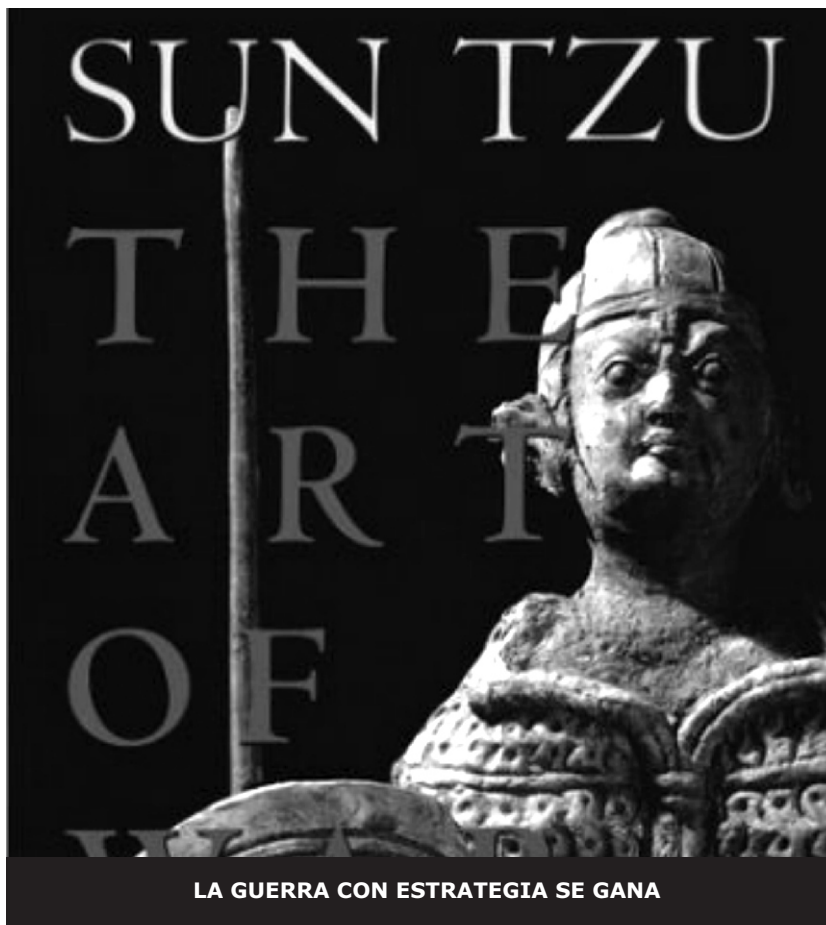
LA GUERRA CON ESTRATEGIA SE GANA

palabras del general Tzu: «Las armas son instrumentos de mal augurio, y la guerra es un asunto peligroso. Es indispensable impedir una derrota desastrosa, y por lo tanto, no vale la pena movilizar un ejército por razones insignificantes: Las armas sólo deben utilizarse cuando no existe otro remedio. Un gobierno no debe movilizar un ejército por ira, y los jefes militares no deben provocar la guerra por cólera. Actúa cuando sea beneficioso; en caso contrario, desiste. La ira puede convertirse en alegría, y la cólera puede convertirse en placer, pero a un pueblo destruido no puede hacerse renacer, y la muerte no puede convertirse en vida. Por lo tanto, los que no son totalmente conscientes de la desventaja de servirse de las armas deben abstenerse de las ventajas de utilizarlas (¡Por Dios! ¡Que alguien le preste este libro a Bush y a sus «halcones», por favooooooooor!).» Los buenos generales, nos dice Tzu, son aquellos que conocen el alma de su enemigo, su lengua, sus sueños, sus frustraciones. El arte de la guerra es la mejor estrategia para evitarla. Conocer el conflicto, su situación,