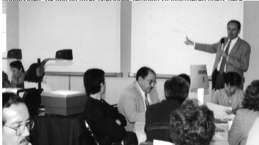
FOMENTANDO APRENDIZAJE E INTERCAMBIO DE IDEAS

Cabe destacar que este chat sólo se llevó a cabo con profesores de la universidad, ya que en otras ocasiones también se efectuarán chats para