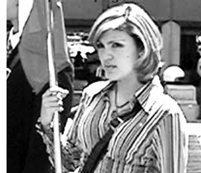
BANDERAS DE AMÉRICA

Asimismo se quiso fortalecer el sentir hispanoamericano; durante el desfile, la bandera de México encabezó el evento seguida de la bandera de España por ser la madre patria, que juntas