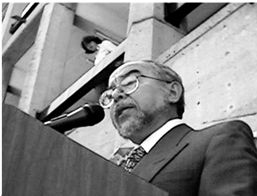
EL ARQUEÓLOGO EDUARDO MERLO, RECORDÓ EL 510 ANIVERSARIO DEL DESCUBRIMIENTO DE AMÉRICA