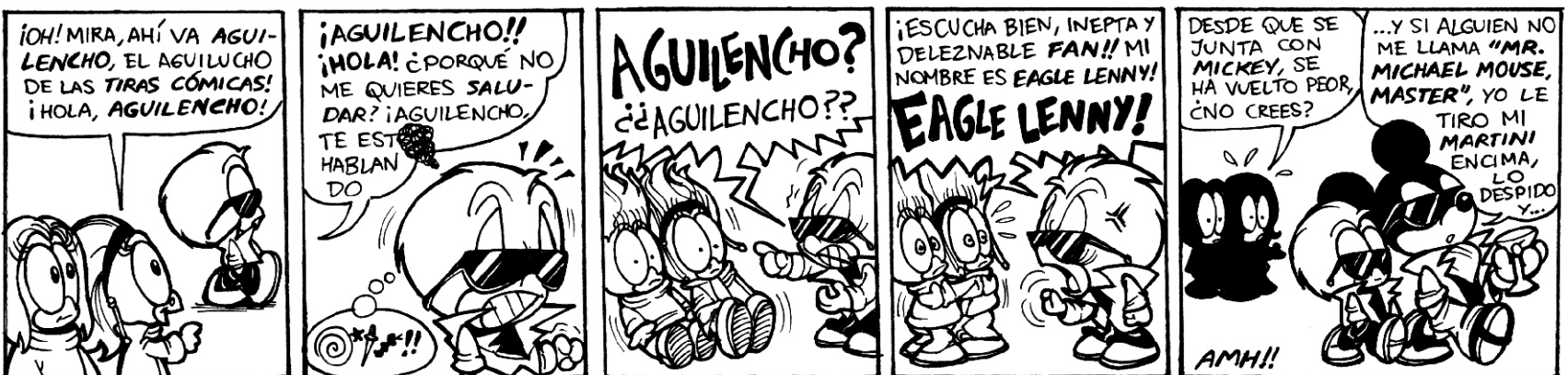
DEDICADA A LAS FANS #1 DEL AGUILUCHO... ELIAS SABEN QUIÉNES SON