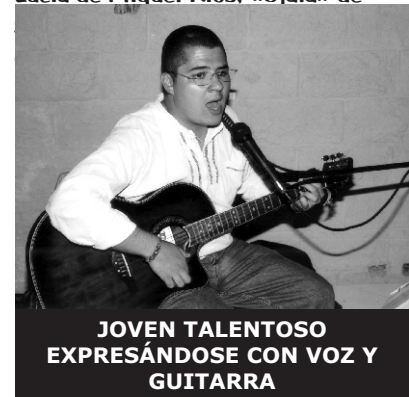
JOVEN TALENTOSO EXPRESÁNDOSE CON VOZ Y GUITARRA

En la primera presentación se escucharon canciones como Santa Lucía de Miquel Ríos, «Ojalá» de