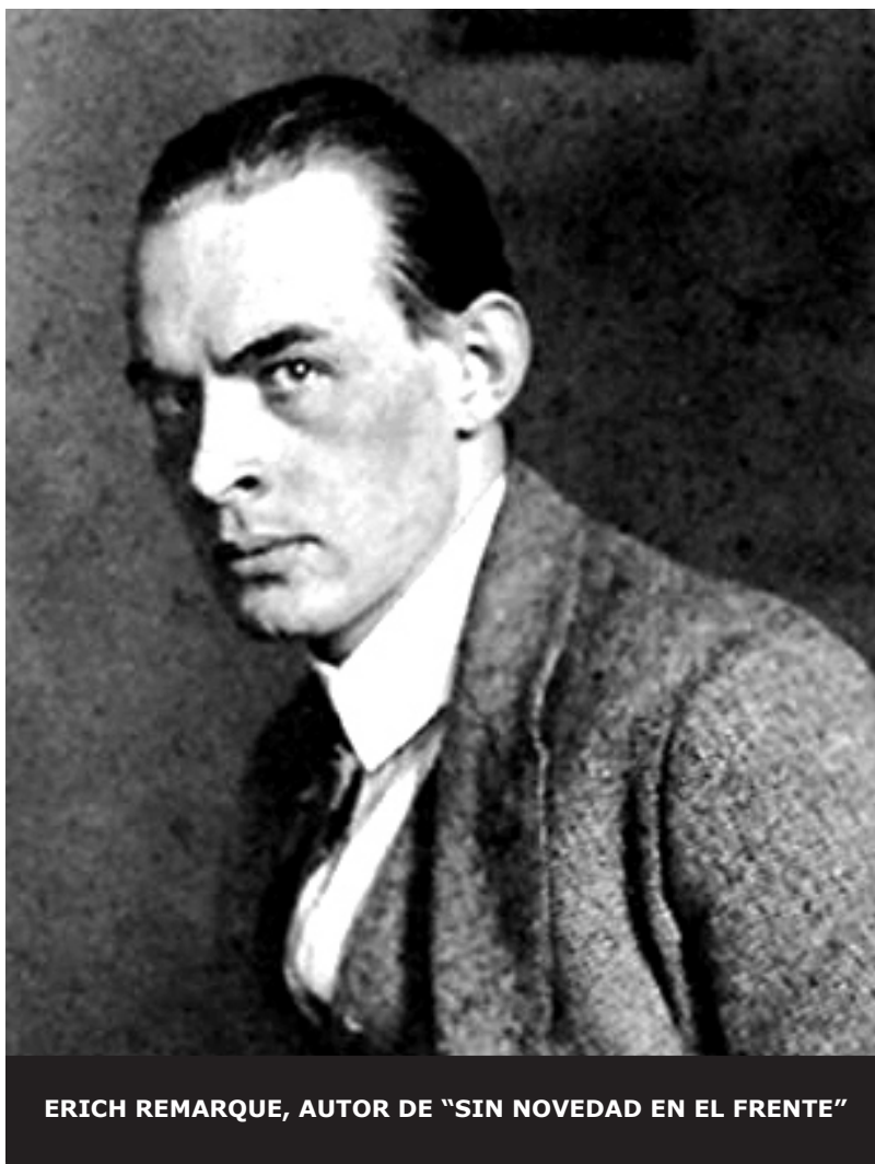
ERICH REMARQUE, AUTOR DE "SIN NOVEDAD EN EL FRENTE"

Es realmente tonto tratar de describir esta novela, la mejor obra