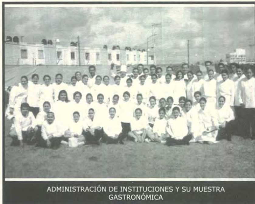
ADMINISTRACIÓN DE INSTITUCIONES Y SU MUESTRA GASTRONÓMICA

Los comensales degustaron estos exquisitos platillos y pasaron una excelente tarde en compañía de sus amigos, principalmente los padres de familia que pudieron apreciar el trabajo realizado por los estudiantes del quinto semestre de Administración de Instituciones.