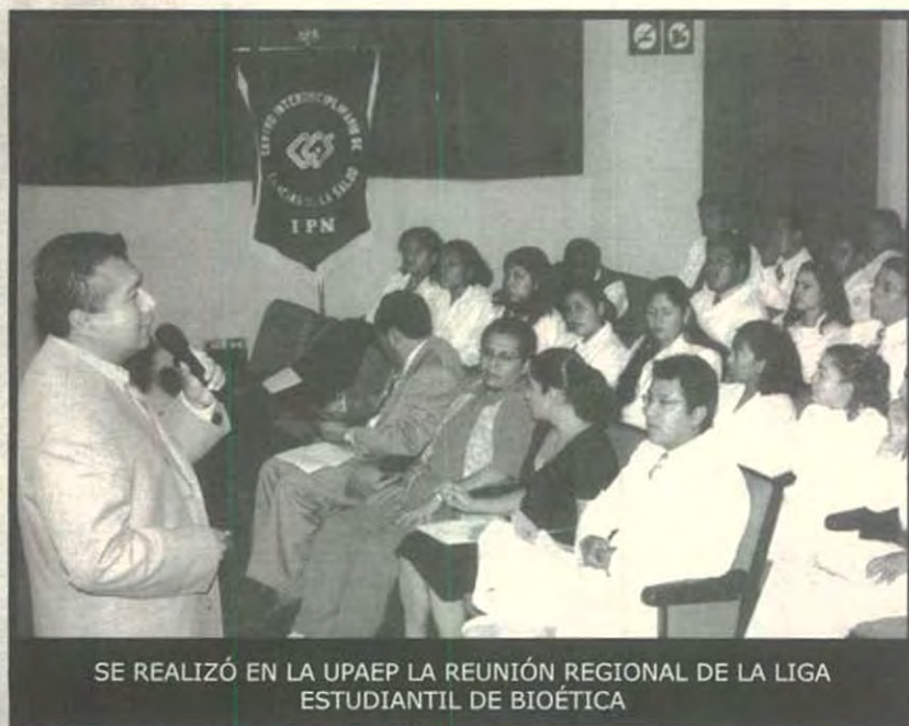
SE REALIZÓ EN LA UPAEP LA REUNIÓN REGIONAL DE LA LIGA ESTUDIANTIL DE BIOÉTICA

Cabe señalar que el Centro Universitario de Estudios de Bioética y el grupo Estudiantes Universitarios por la Vida están interesados en promover conferencias, investigaciones y trabajos a favor de la vida y con una ética basada en la dignidad de la persona, ya que muchas veces se deja a un lado esta visión y sólo se basan en el lado científico.