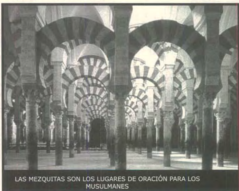
LAS MEZQUITAS SON LOS LUGARES DE ORACIÓN PARA LOS MUSULMANES

¿Entienden cómo opera el sistema de yihad ? Si matas a un musulmán en la calle, su familia te perdonará, y no lo entenderás ; pero si lo matas o lo lastimas en oración, ofendes a Alá, pues en ese momento ese hombre pertenece a Alá... y la ofensa a Alá puede ser perdonada por Alá, pero no por el creyente, entonces buscarán castigarte por ello, y tampoco lo