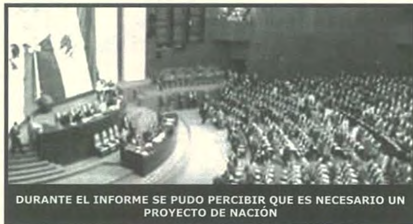
DURANTE EL INFORME SE PUDO PERCIBIR QUE ES NECESARIO UN PROYECTO DE NACIÓN

verdad las fuerzas políticas se pusieran de acuerdo, ¿cuál es nuestro proyecto de nación? Ese es el verdadero problema, no tenemos un proyecto de nación definido, ni a corto ni a largo plazo, el país avanza según soplan los vientos de la macroeconomía, de los intereses de unos cuantos, de las encuestas de popularidad, de cómo les vaya a nuestros