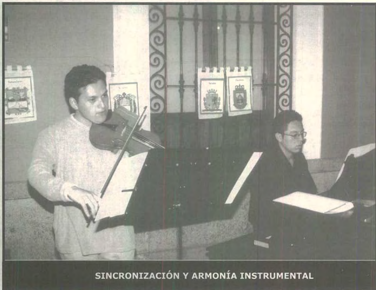
SINCRONIZACIÓN Y ARMONÍA INSTRUMENTAL

* El Museo UPAEP, cuenta con diversos eventos a realizar