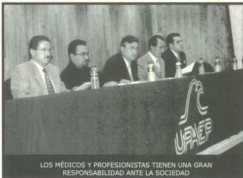
LOS MÉDICOS Y PROFESIONISTAS TIENEN UNA GRAN RESPONSABILIDAD ANTE LA SOCIEDAD

Hizo un llamado porque la comunidad médica del estado desarrolle el uso de las herramientas tecnológicas y de áreas poco conocidas como la bioética y el bienestar del ser humano sin alterar su naturaleza. Resaltó que por esa razón se necesita fomentar una convivencia más humana en este tercer milenio con la finalidad de apoyar los avances necesarios para el crecimiento de la medicina y la salud de la humanidad.