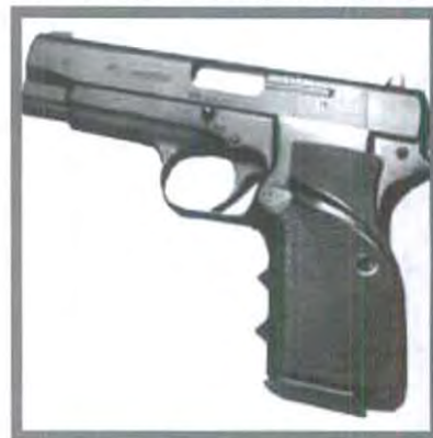
LA VIOLENCIA GENERA VIOLENCIA