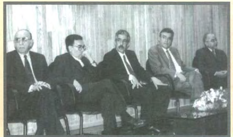
IMPORTANTES PERSONALIDADES ESTUVIERON EN EL PRESIDIO DURANTE LA PRESENTACIÓN

4 años de trabajo, 61 monumentos, 2 tomos de aproximadamente 400 páginas cada uno, más de 800 fotografías e imágenes, impresión a color, altares, monumentos, iglesias, mapas y 4,000 ejemplares constituyen la materia de