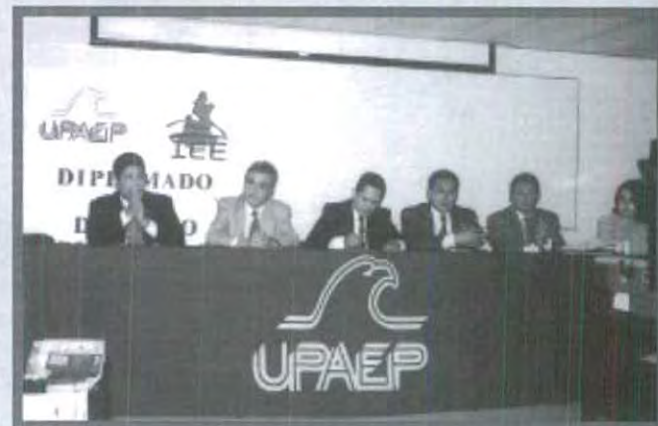
INICIÓ EL DIPLOMADO EN DERECHO ELECTORAL