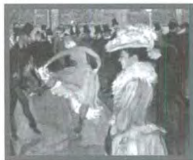
EN EL MOULINE ROUGE: EL BAILE, DE TOLOUSE

Así, después de haber sufrido otro ataque que provocó la parálisis de la mitad de su cuerpo, Henri Toulouse-Lautrec murió el 9 de septiembre de 1901 en el castillo de Malromé, donde vivía con su madre.