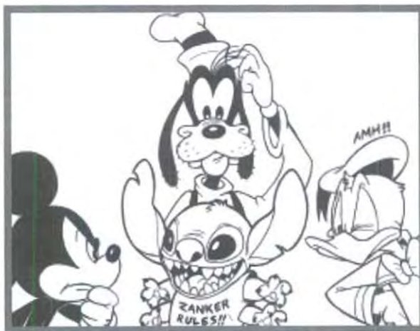
UN NUEVO PERSONAJE EN LA CASA DISNEY

Comentarios, quejas, insultos y dibujos a: thezanker@hotmail.com