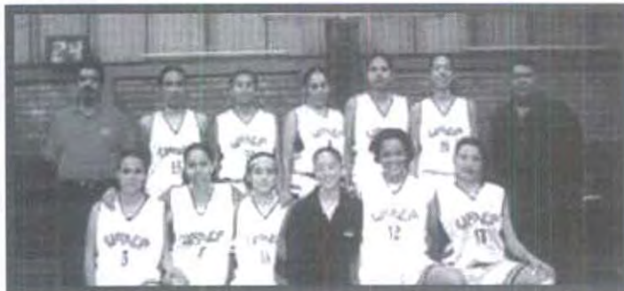
EQUIPO DE BALONCESTO FEMENIL DE LA UPAEP