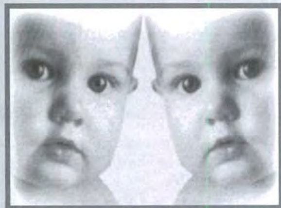
CLONACIÓN HUMANA, ¿CREACIÓN DE HOMBRES IDÉNTICOS?

La clonación humana ha sido y será un tema de gran controversia en el mundo entero. Primero que nada, me gustaría mencionar algunas características de la clonación. La clonación humana es la reproducción de un ser idéntico y puede ser de dos tipos: por división embrionaria o por transferencia nuclear de células somáticas. Entre algunas de las finalidades de este procedimiento se encuentran el proporcionar hijos a parejas estériles y el evitar la transferencia de enfermedades hereditarias.