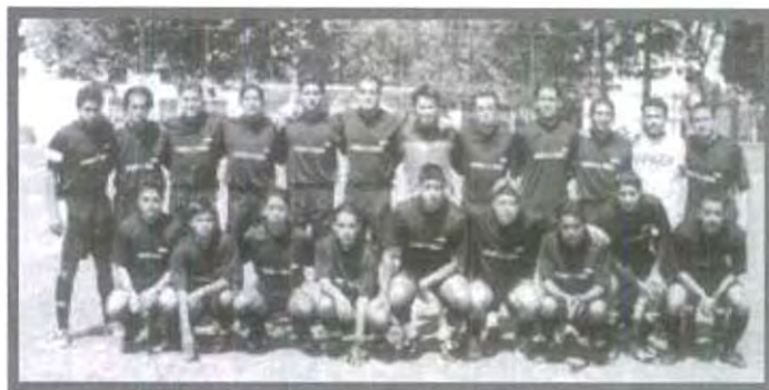
CONSIGUIERON LA CALIFICACIÓN PARA EL CONDDE