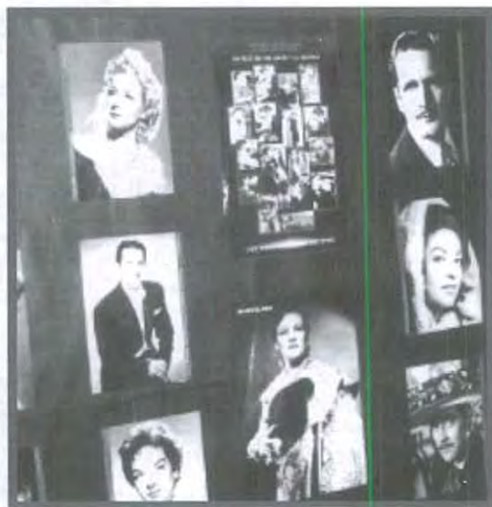
EXPOSICIÓN DE DIFERENTES ETAPAS DEL CINE

A solicitud de los alumnos de Ciencias de la Comunicación, el pasado jueves 11 de abril se inauguró la exposición: "El cine a través del tiempo".