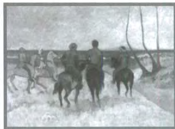
JINETES EN LA PLAYA DE GAUGUIN

Tras una serie de problemas con las autoridades de Tahití, se trasladó a Atuana, donde murió el 8 de mayo de 1903.