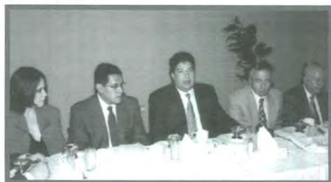
UNIÓN DE ESFUERZOS PARA GESTAR UNA CULTURA CÍVICA Y ELECTORAL

Para concluir, recalcó que el objetivo es llegar a la mejora de cada uno de los IEE de los 217 municipios que conforman el estado de Puebla, a lo cual comentó: «es una tarea ardua que se tiene que realizar en 2 ó 3 años, por lo que esperamos que para el mes de marzo de 2004 se concluya la profesionalización de este organismo, así como lograr metas en el sentido del conocimiento que adquieran los alumnos en torno a los procesos electorales, el cual irá dirigido a toda la población estudiantil».