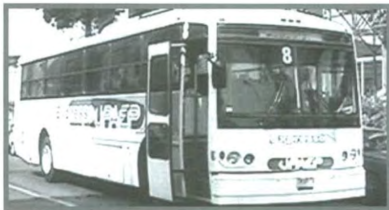
EXPRESO UPAEP, A TU SERVICIO

Te invitamos a que observes detenidamente la ruta del Expreso UPAEP, y ubiques la parada que te quede más cercana.