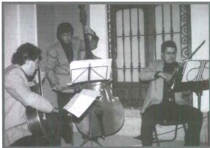
EXPRESIÓN CULTURAL, MATERIALIZADA EN ONÍRICO

Diez minutos después de las 20:00 de la noche, los músicos comenzaron a interpretar música barroca, impresionista y romántica de los siglos XVI, XVII y XVIII de los autores Rosenmuller, Scheidlare, Carulli y Ferrer.