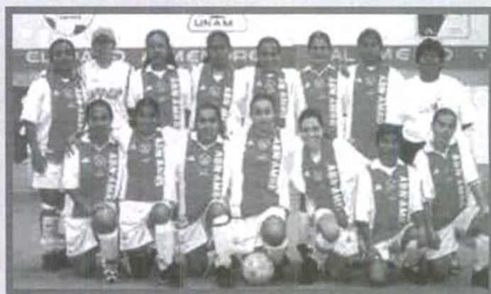
EQUIPO DE FUTBOL RÁPIDO FEMENIL

Finalmente es claro que este equipo ha ido de menos a más, pues en los torneos que ha disputado ha logrado buenos resultados, el año pasado terminaron invictas el CONADEIP regional, en el CONADEIP nacional ocuparon el cuarto lugar y ahora en la etapa estatal y regional del CONDDE disputaron 12 juegos, ganaron en tiempo normal 9, ganaron un juego en shoot out y cayeron solamente en un par de ocasiones, anotaron 67 goles y recibieron 22 goles.