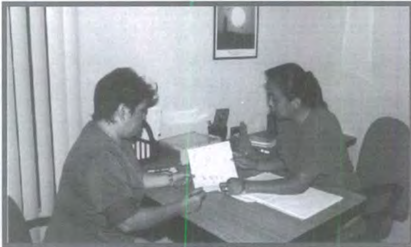
LO QUE BIEN SE APRENDE DESDE EL AULA SE PRACTICA

Entorno a la celebración del día del Maestro el próximo 15 de Mayo el Departamento de Humanidades organizará diversos actividades entre las que se encuentra la inauguración de nuestra "Consultoría Psicopedagógica" mostrando un logro más de nuestra Institución. ¡Enhorabuena!