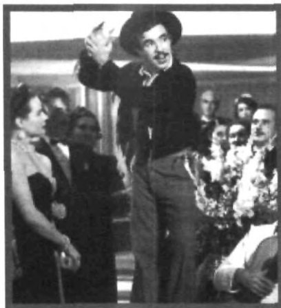
TIN TAN, EL REY DEL BARRIO Y DE LOS PACHUCOS

Tin Tán y su traje es el prototipo de eso que se llamó pachuco. Como referencia, checa la película "El Rey del Barrio" todavía la rentan en los videoclubes y de vez en cuando la pasan en la tele.