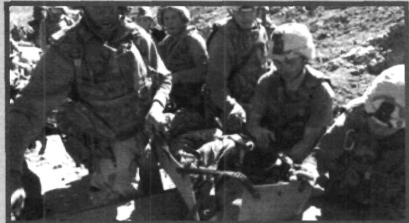
LA GUERRA NO CONDUCE A NINGÚN CAMINO