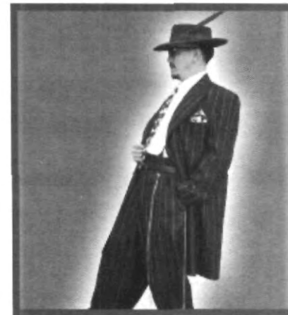
EL CLÁSICO PACHUCO

Los jóvenes de las vecindades mexicanas se identificaron con esta onda y así el movimiento- que duró poco- tuvo presencia en nuestro país.