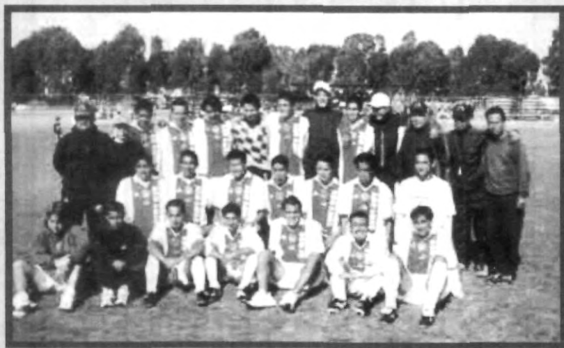
CAMPEONES DE LA CONADEIP