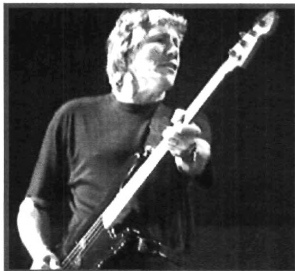
EL MAESTRO WATERS

La sentencia del juez de The Trial halla gran aceptación. Es una lástima que no haya una pared de verdad. Los aquí presentes la tiraríamos sin ningún problema, y sería un digno colofón a este magnífico recital. No importa; el hombre ya se va, y desde luego, todos le obsequiamos con una atronadora ovación de pie. Mil gracias, señor Waters. Ha sido un verdadero placer dejar de lado a los alumnos y, por una vez, escuchar al maestro. Comentarios, quejas e insultos a: thezanker@hotmail.com