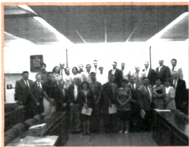
EL AUTOESTUDIO ES UN ESFUERZO DE TODOS LOS QUE INTEGRAMOS ESTA COMUNIDAD UNIVERSITARIA

El sistema de evaluación abarca once categorías: filosofía institucional; propósitos, planeación y efectividad; normatividad,