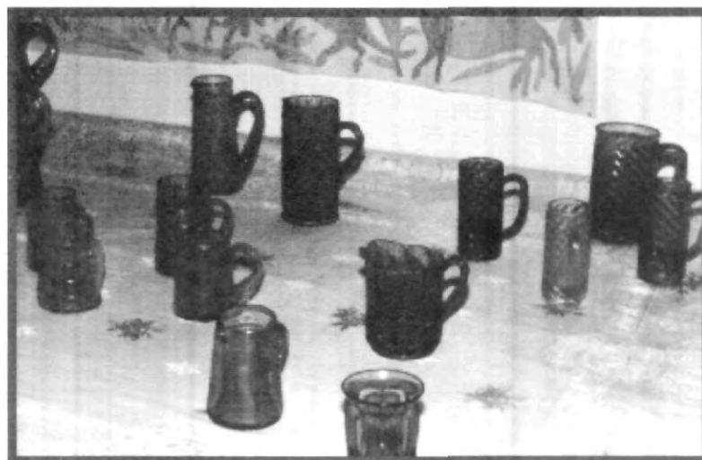
UN SINNÚMERO DE JARRAS, JARRONES Y VASOS PULQUERON CONFORMARON LA EXPOSICIÓN "JARRAS

Con esta conferencia el Museo UPAEP dio por terminado este ciclo de conferencias, el cual de igual forma finalizó con la exposición "Jarras Pulqueras", la cual permaneció abierta al público durante dos meses.