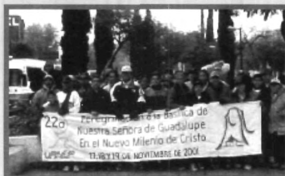
INTEGRACIÓN UNIVERSITARIA Y ASUNTOS ESTUDIANTILES UNIERON SUS ESFUERZOS PARA EMPRENDER ESTE VIAJE