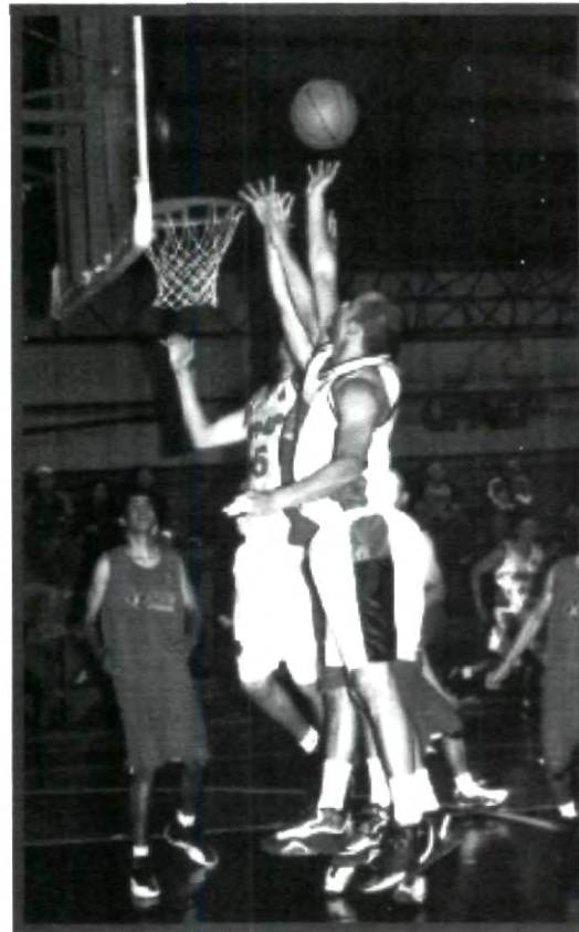
LAS ÁGUILAS ESTÁN DISPUESTAS A ENFRENTARSE EL PRÓXIMO 23 DE ENERO DE 2002 ANTE LOS AZTECAS DE LA UDLAP

No queda más que decir, gracias Águilas por ponernos en lo más alto, ojalá y sigan así.