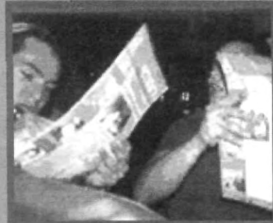
EL GRUPO MUSICAL RAGAZZI FIRMA EL UNIVERSITARIO