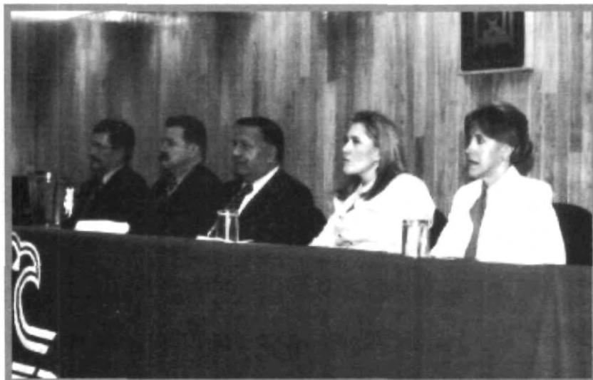
DURANTE EL CONGRESO LOS ALUMNOS DE ODONTOLÓGIA ACTUALIZARON SUS CONOCIMIENTOS DE ORTODONCIA, OCLUSIÓN, Y CIRUGÍA, ASÍ COMO TUVIERON LA OPORTUNIDAD DE PRESENCIAR LAS NUEVAS INVESTIGACIONES REALIZADAS

Odontología de la UPAEP también ofrece los diplomados: Implantología protésica y quirúrgica, sobredentaduras y odontología cosmética y carillas de porcelana.