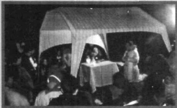
DURANTE LA PEREGRINACIÓN SE ESTRENÓ UNA NUEVA RUTA PARA LLEGAR A LA BASÍLICA DE GUADALUPE