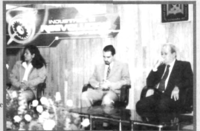
LOS ALUMNOS DE ING. INDUSTRIAL TUVIERON LA OPORTUNIDAD DE PRESENCIAR EN DÍAS PASADOS SU ÚLTIMO CONGRESO DEL 2001

Luego vinieron los mariachis y los abrazos de alegría y satisfacción de los organizadores, quienes pueden sentirse orgullosos de haber organizado el congreso que ha marcado precedentes, que será la marca a superar. Enhorabuena!!